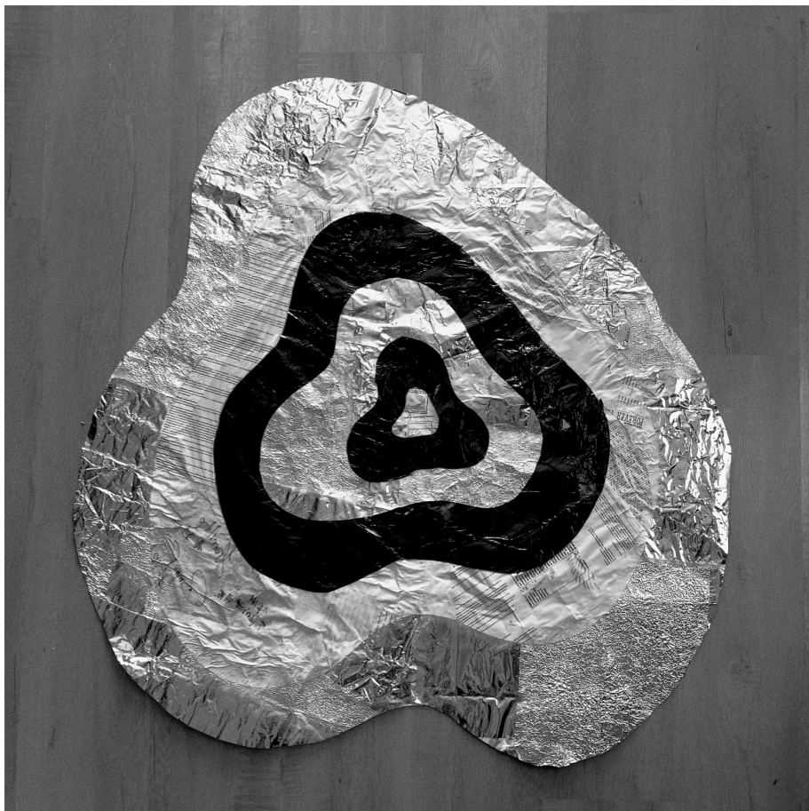
Pieza artística Street Trash