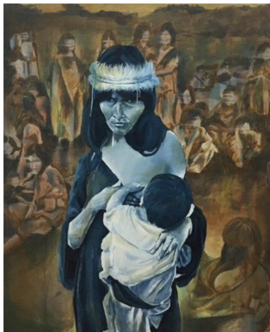
Figura 2: Confrontación (Choco, L. 2024)

La obra guía al espectador a través de un viaje simbólico que representa tres momentos del desafío y la resiliencia que enfrentan las mujeres Shuar. El cuadro central la confrontación con los estereotipos de género arraigados, poco favorables a la comunidad, con una representación visual detallada (véase figura 2).