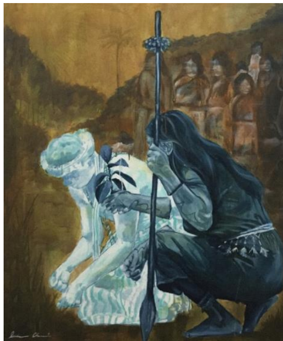
Figura 3: Lucha (Choco, L. 2024)

En el segundo cuadro de la composición, ubicado a la izquierda, propone una narrativa visual que se expande para encapsular el momento de lucha como manifestación de resiliencia y búsqueda de equidad (véase figura 3).