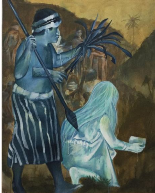
Figura 4: Renacer (Choco, L. 2024)

El último cuadro de la composición, situado a la derecha, encapsula el tercer y culminante momento que simboliza el renacer. Esta etapa representa la noción de superación, triunfo y felicidad alcanzados mediante el empoderamiento (véase figura 4).