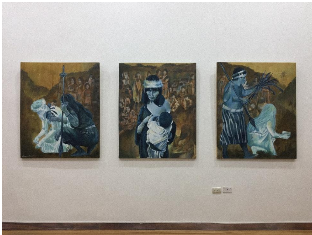
Figura 1: Resiliencia (Choco, L. 2024)

Con respuesta a la problemática planteada en el apartado anteriormente, se presenta la siguiente obra Resiliencia (véase figura 1).