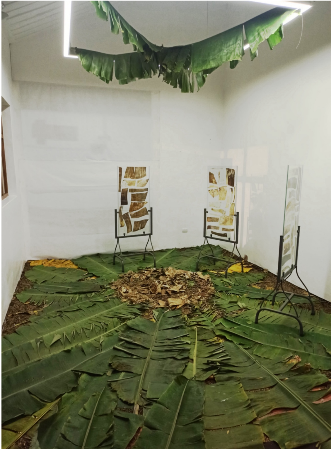
Figura 1. Fotografía de la instalación colocada en la Casa Arte- Museo Universitario(Fuente: Obra de M.P. Arévalo, 2024)