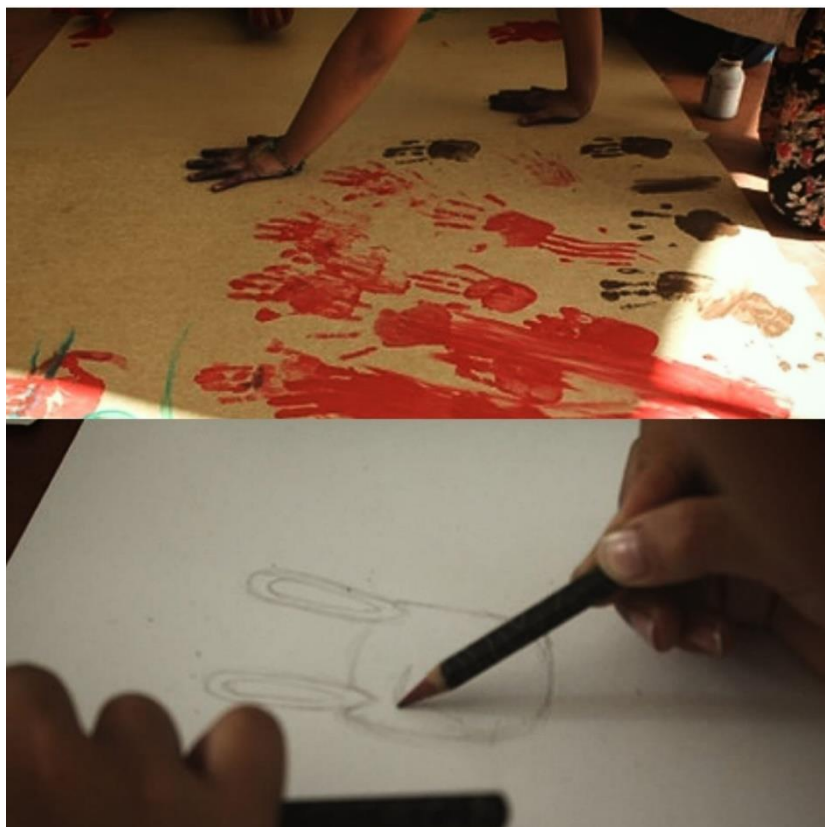
Figura 2: Sesión 1