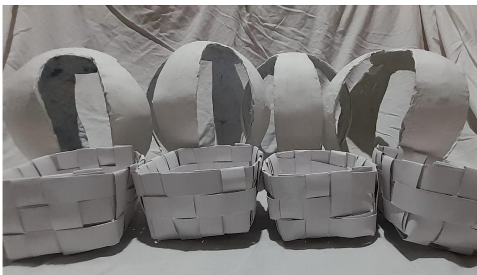
Figura 4: Proceso

En el segundo proceso se basó en la realización de las canastas con cartulina como material predominante, aquí se aplicó la técnica del tejido, haciendo tiras de cartulina largas con ayuda de pegamento blanco, se tejió 6 canastas con cartulina blanca para mayor facilidad de la adherencia de la pintura, de igual manera para la colocación de la canasta hacia el globo se realizó con hilos de colores (naranja, azul y amarillo) unas trenzas de tres extensas (véase figura 4).