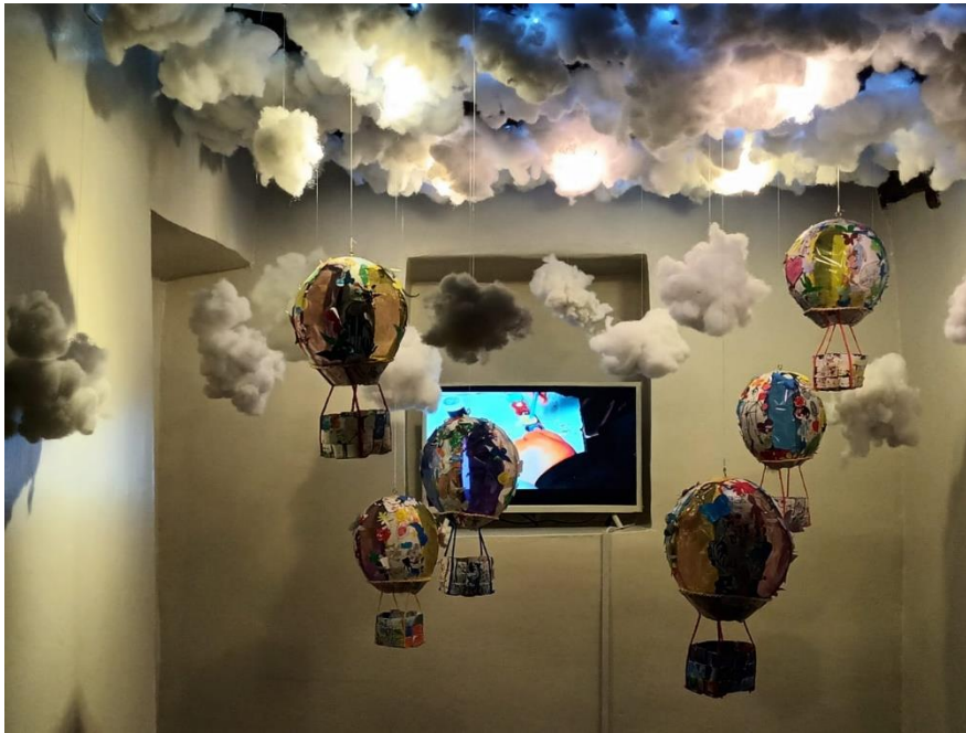
Figura 1: Pensamiento Inefable