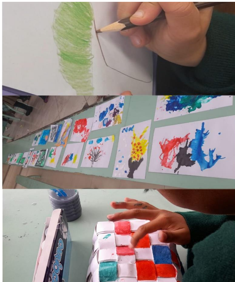
Figura 3: Sesión 2