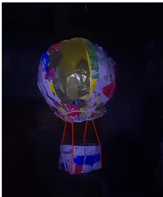
Figura 5: Globo aerostático (Autor: María Fernández, 2024).

Cada uno de los globos son envueltos por una capa de collage, que no sigue un orden específico, ya que denota el caos creativo que puede ocasionar trabajar con niños de distintas edades, dando un contraste bastante marcado en su forma de pensar y en la visión que tienen. Las canastas fueron intervenidas directamente por los niños en donde se utilizó distintas técnicas para llegar a colorear sus paredes.