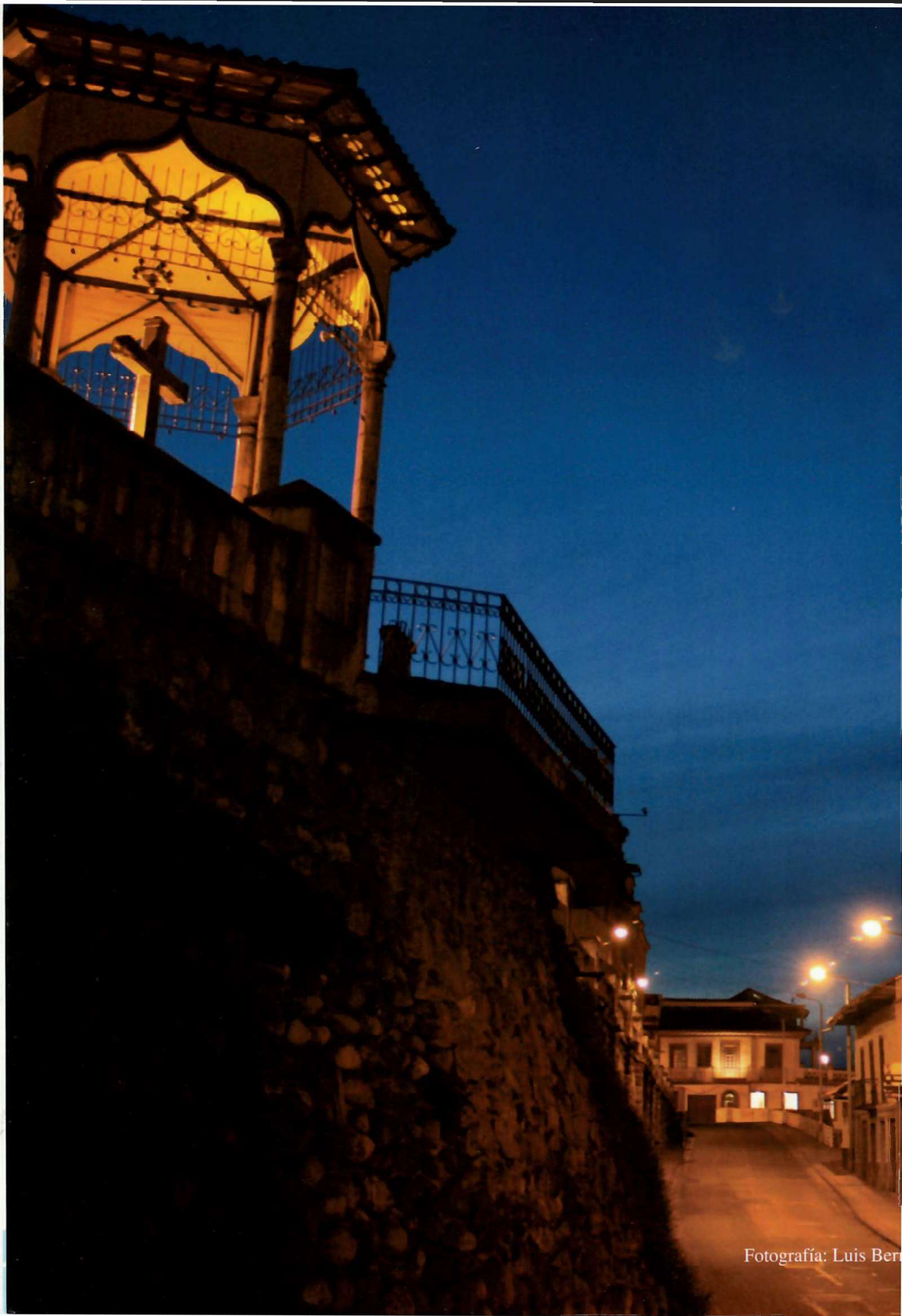
Fotografía: Luis Bern...