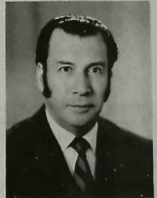
Sr. Dr. PLUTARCO NARANJO V., Presidente del VIII Congreso Médico Nacional.

Por otra parte, en el ámbito nacional, está en marcha un delicado proceso de integración de los dispersos servicios asistenciales y preventivos. Las necesidades médicas crecen con extrema rapidez: Se necesitan nuevos y más costosos equipos de diagnóstico, rehabilitación y tratamiento; los nuevos medicamentos tienen precios inaccesibles para la gran masa de nuestra población y frente a este panorama el crecimiento de los recursos económicos destinados a la salud es lento y menguado.