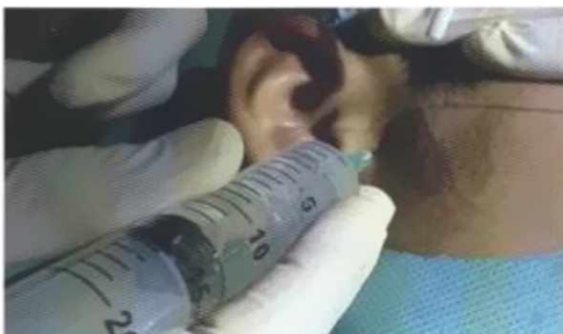
Figura 2: Primera punción ubicada 10 mm por delante del tragus y 2 mm por debajo de la línea tragocantil, en dirección a la cavidad glenoidea.

Se inserta la aguja en el espacio articular superior, en dirección a la cavidad glenoidea y se infiltra 2 ml de solución de Ringer Lactato con fines de distensión de dicho espacio. se pide al paciente ejercicios de apertura y cierre para generar una mezcla dilución de líquido sinovial y solución de irrigación, seguido del bombeo en 10 ocasiones de aspiración y reinyección para eliminar adherencias sobre el disco articular.