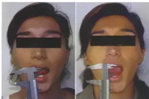
Figura 5 y 6: Control preoperatorio una apertura interincisal de 16 mm 6: Control posoperatorio a un mes con una apertura oral de 26 mm.

Se realiza técnica propuesta de artrocentesis previo al fracaso de manejo conservador de 2 meses con terapia de ATM y uso de guarda oclusal.