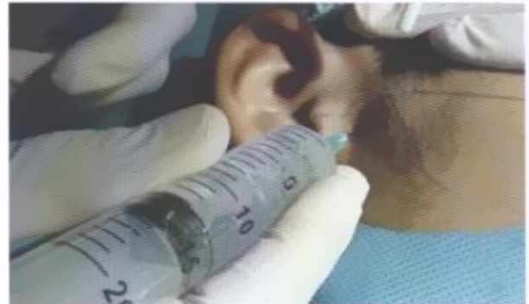
Figura 3: Segunda punción ubicada 20 mm por delante del tragus y 10 mm por debajo de la línea tragocantil, en dirección a la eminencia articular.

Una segunda aguja es insertada en el área de la eminencia articular para establecer un libre flujo de la solución de irrigación a través del espacio superior.