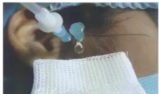
Figura 4: Lavado a libre flujo del espacio articular superior a baja presión.

La articulación es irrigada con 300 ml de solución Ringer Lactato a baja presión (10 a 12 ml/min) por medio de una bolsa de infusión a 1.5 m de elevación en relación a la ATM.