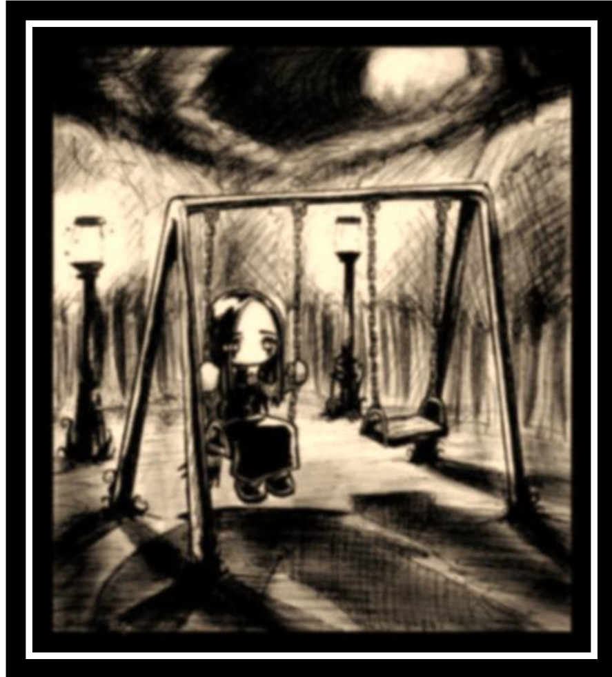
ILUSTRACIÓN II "LAS TRIBUS URBANAS"