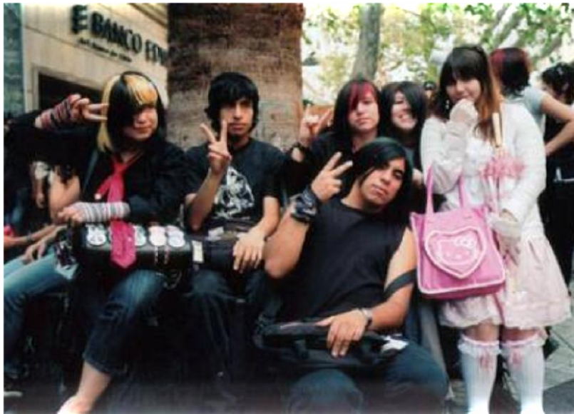
ILUSTRACIÓN I "ADOLESCENCIA <EMO>"