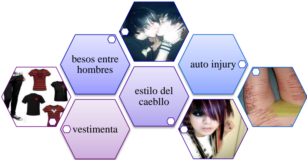
IMAGEN 1 TIPO DE VESTIMENTA DE LOS ADOLESCENTES EMOS

de color negro entubados, riatas de tachas, estrellas en las correas pigmentos rosa, pelo de medio lado cubierto el ojo derecho, piercing en la ceja izquierda y el labio inferior izquierdo, colores rosado, morado y negro principalmente, para hombres y mujeres, maquillaje de los ojos al estilo gótico para ambos sexos, Muestran el bóxer” (ALELIN WORDPRESS, 2008)