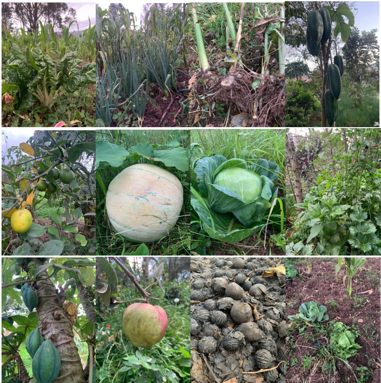
Figura 2 Algunos ejemplares de la producción agroecológica

Nota: Destacan productos como: acelga, cebollín, ajo, babaco, limón, zapallo, apio, chamburo, manzana, nogal, col y lechuga.