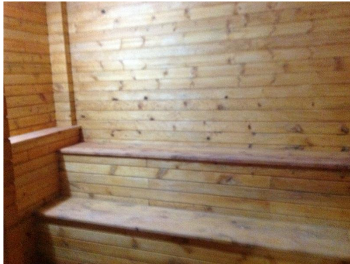
Foto Nº. 5 Instalaciones Sauna “Termales de las Nieves Puertas del Cielo”. 18 julio 2013.

Servicio de Sauna: El parador Eco turístico “Termales de las Nieves Puertas del Cielo” cuenta también con Sauna que tiene efectos beneficiosos sobre el organismo, al liberar, mediante sudoración, que suele ser abundante y rápida, toxinas y activar la circulación sanguínea. Siempre va acompañada con contrastes de temperatura, a la sesión de calor le sigue una de enfriamiento, que amplía los efectos de la sudoración. Se toma con fines higiénicos y terapéuticos.