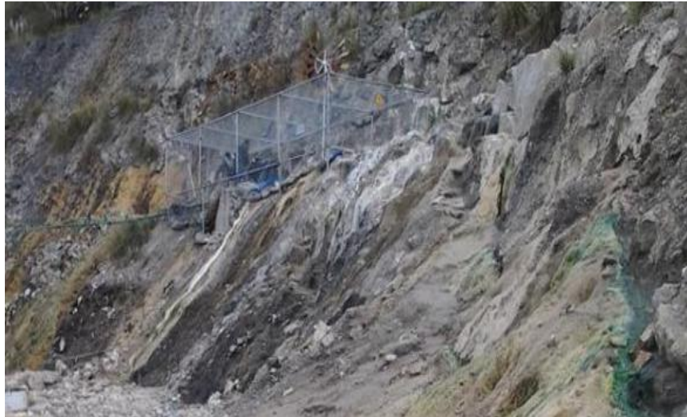
Foto N°. 9 Energía fotovoltaica y eólica del Parador Eco turístico “TNPC” Foto: Tannya González Verdugo. 22 julio 2013.

Otra de las energías limpias que en estos días se están implementando en el Parador Eco turístico son los paneles solares que funcionan a base a las radiaciones solares, lo que sustituirá el uso de la energía eléctrica del local y el gas industrial que se utiliza en el área de Alimentos y Bebidas.