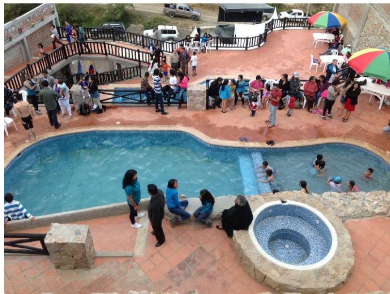
Foto Nº. 4 Piscinas “Termales de las Nieves Puertas del Cielo”. 28 junio 2013.

Servicio de Piscinas termales: Guapán posee una gran riqueza, como constituyen las aguas termales que además tienen grandes beneficios para la salud. En el Parador Eco turístico las piscinas son de aguas 100% termales, cuenta con 2 piscinas.