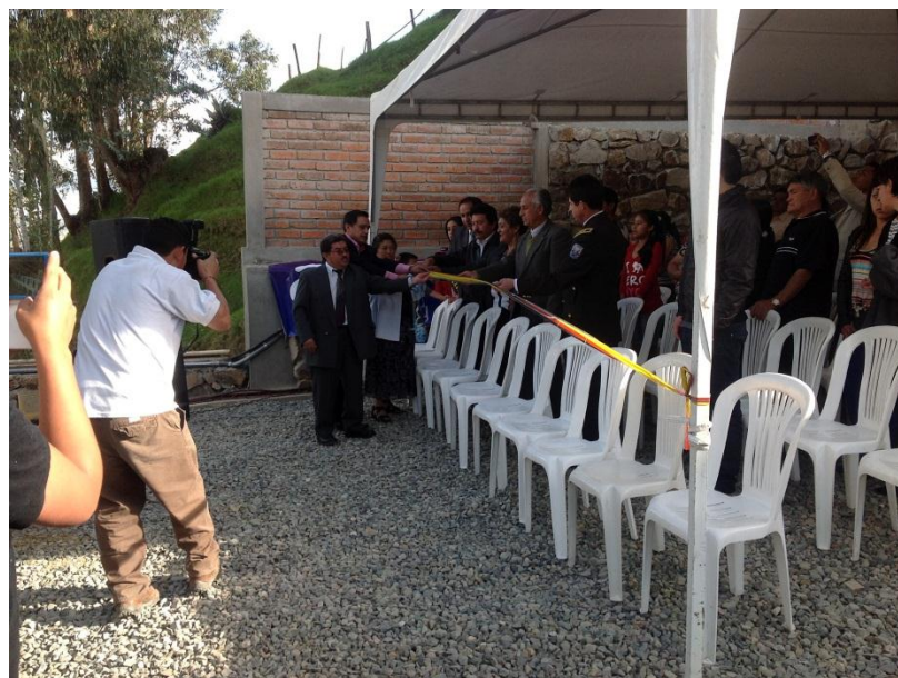
Foto N°.2 Inauguración Parador Eco turístico “Termales de las Nieves Puertas del Cielo”. Foto: Tannya González Verdugo 28 junio 2013.

Las puertas del Parador eco turístico “Termales de las Nieves Puertas del Cielo” fueron abiertas al público el 28 junio de 2013, con un programa de inauguración, en dónde estuvieron presentes algunas autoridades del Cantón Azogues, Ingenieros que estuvieron a cargo de los Paneles Solares, Energía Eólica y Fotovoltaica, y público de los alrededores del Parador.