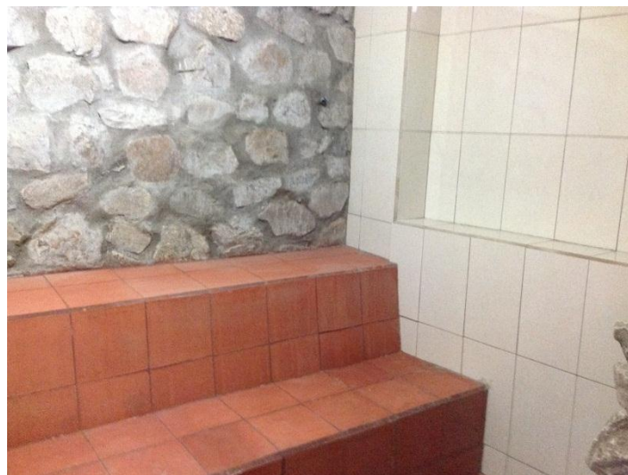
Foto Nº. 6 Instalaciones Sauna “Termales de las Nieves Puertas del Cielo”. 18 julio 2013.