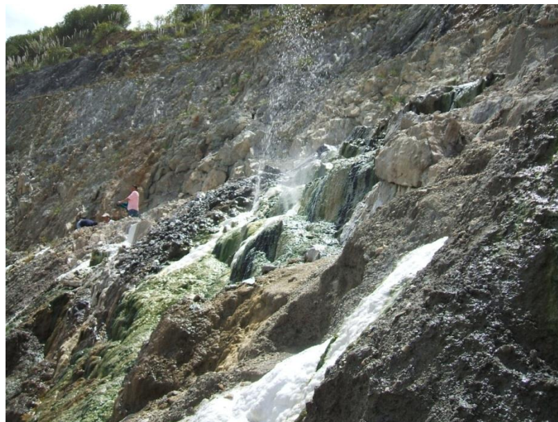
Foto N°. 8 Aguas termales de la Parroquia Guapán 23 agosto 2012.

El Parador Eco turístico como ya se dijo, está localizado en la Parroquia Guapán, misma que posee una gran riqueza tanto turística como medicinal: sus aguas termales, se ha decidido analizar en el presente capítulo ya que son parte importante para que se haya creado el Parador Eco turístico “Termales de las Nieves Puertas del Cielo”. Hasta el año 2004 estas aguas permanecieron en el abandono. Estas aguas fueron descubiertas en el año de 1958, se puede decir que prácticamente por accidente, ya que se encontraban trabajadores de la Empresa Industrias Guapán realizando excavaciones para obtener la materia prima para el cemento