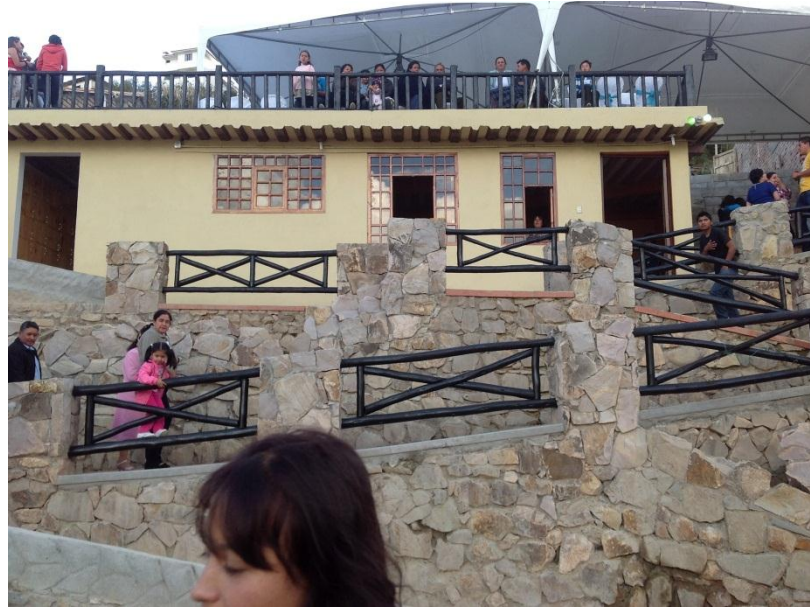
Foto Nº. 3 Parador Eco turístico "Termales de las Nieves Puertas del Cielo". 28 junio 2013.