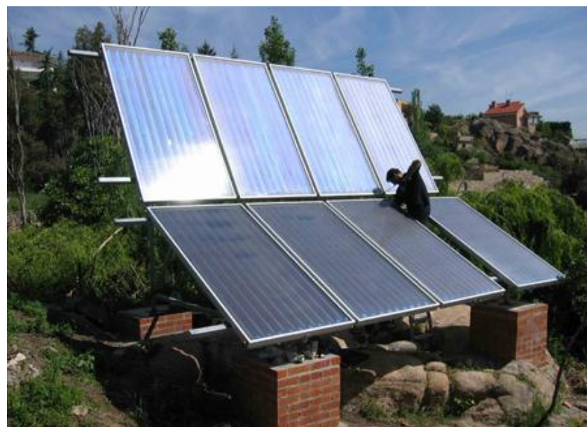
Gráfico N°. 1 Paneles Solares

Otra de las energías limpias que en estos días se están implementando en el Parador Eco turístico son los paneles solares que funcionan a base a las radiaciones solares, lo que sustituirá el uso de la energía eléctrica del local y el gas industrial que se utiliza en el área de Alimentos y Bebidas.