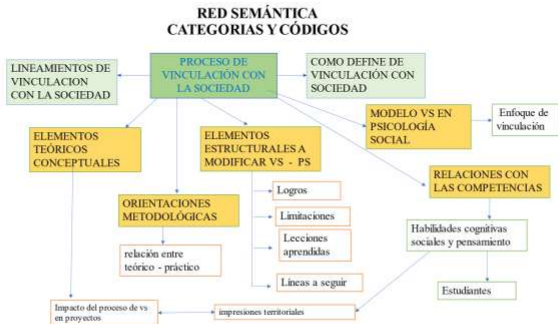
Figura 1. Elaborado por la autora.