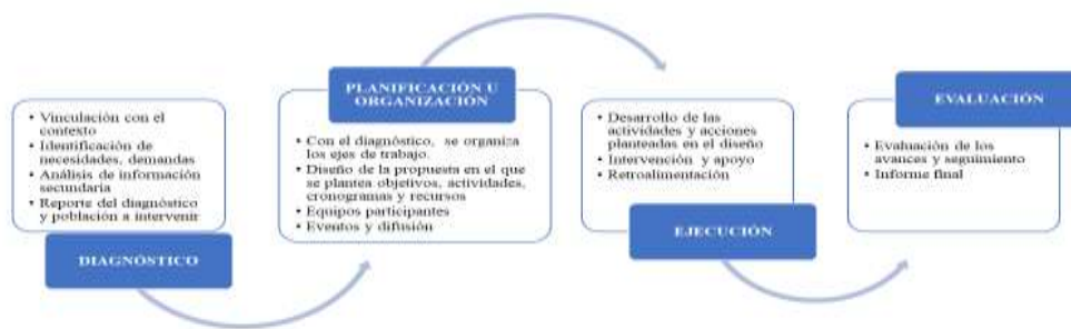
Figura 2. Elaboración de la autora

Tomando como punto de partida esta concepción de la vinculación con la sociedad, los lineamientos y estructura de proyectos son los cimientos, por una parte, que responda a los aprendizajes educación superior y por otra parte al desarrollo profesional, estos ejes serían fundamentales: