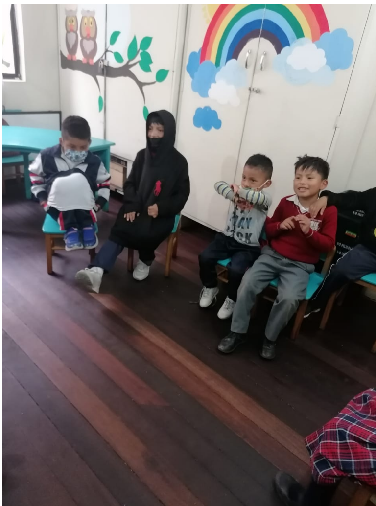
Socialización del objeto de apego