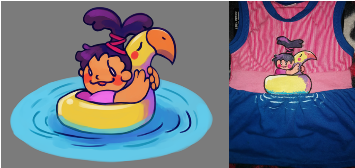
Ilustración Yulexy, acrílico en prenda de vestir

Una vez que se pintó cada ilustración en las prendas de vestir se procede a la ideación de la instalación con la intención de recrear un escenario doméstico que apela a la cotidianidad, así, se construye una estructura que funciona a manera de tendedero en el que se colocan las prendas a una altura pensada para que puedan ser alcanzadas por niños y niñas.