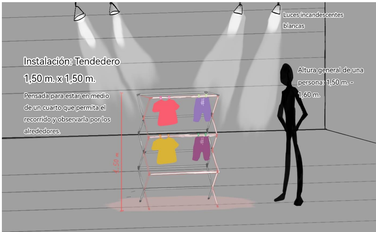
Boceto de estructura