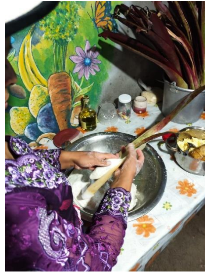
Yanza, M. (2021)

Por esta iniciativa Sisid Anejo han recibido reconocimientos por parte del Instituto Nacional de Patrimonio Cultural e incluso recibieron su ayuda para lograr construir el hostel que ahora tienen para ofrecer un servicio completo con el hospedaje.