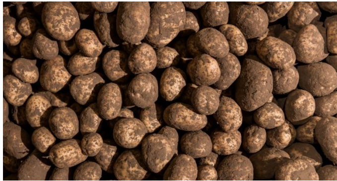
Vásquez, K. (2021)

El valor nutricional de este alimento depende de varios factores como; variedad, tipos de cocción, tamaño, porcentaje en la comida, lo que más aporta este alimento es; agua, fibra, carbohidratos y proteínas, siendo así el cuarto alimento más consumido en todo el mundo.