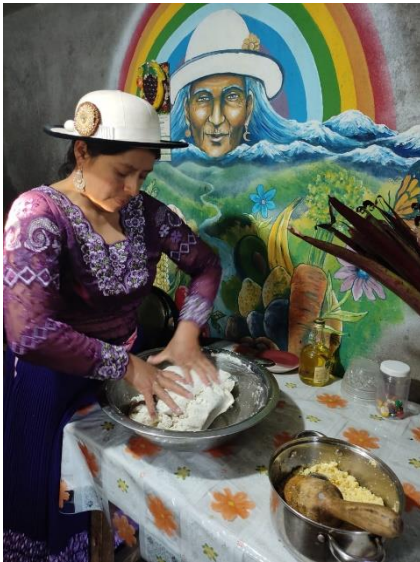
Yanza, M. (2021)