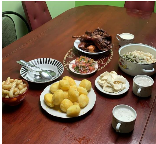
Yanza, M. (2021)

Otro de los platos típicos reconocidos es el envuelto más famoso del Cantón Cañar, de igual manera que el cuy con papas se lo puede realizar en conjunto con la comunidad.