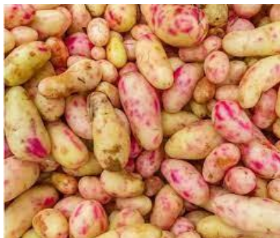
Foto número 6: Melloco