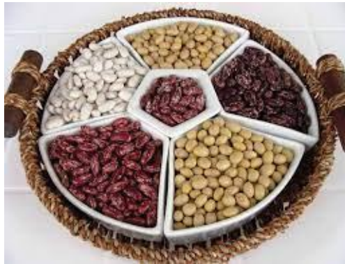
Foto número 5: Fréjol