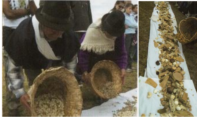
Imagen de la pampa mesa durante la pachamanca

http://repositorio.ute.edu.ec/bitstream/123456789/13066/1/48660_1.pdf