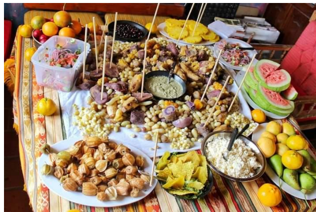
Yanza, M. (2021)

La pampa mesa es la principal actividad gastronómica que ofrece este emprendimiento, se puede reservar con un mínimo de 5 personas y no existen un máximo, como se puede observar en la imagen se ofrecen diferentes platos e ingredientes típicos del cantón como: mellocos, camote, habas quesillo, uvillas, papas, ají de pepa de zambo.