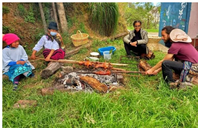
Yanza, M. (2021)