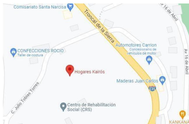
Ilustración 1. Ubicación geográfica. Cañar, Azogues "Hogares Kairós". Fecha: 07/12/21.

El centro de rehabilitación “Hogares Kairós”, especializado en tratamiento de adicciones al alcohol y las drogas; cuenta con dos sedes, la primera en la provincia del Azuay en el cantón Paute y la segunda que se encuentra ubicado en la provincia del Cañar en la ciudad de Azogues en la calle Julio Tobías Torres, centro en el que se enfoca el estudio.