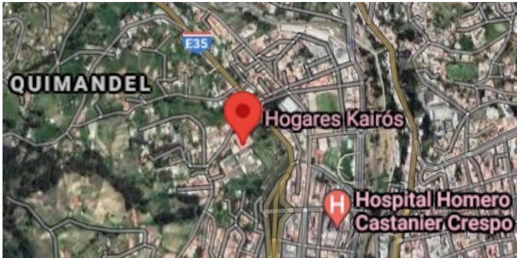
Imagen 1. Ubicación Hogares Kairós CETAD-Azogues.