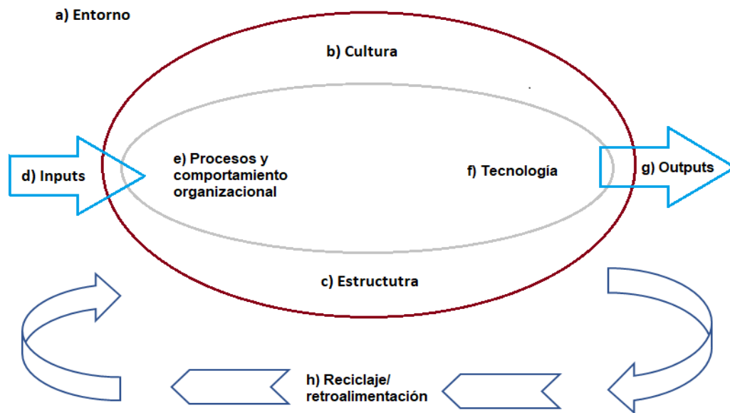
Figura 3. Esquema según modelo sistémico de Harrison.