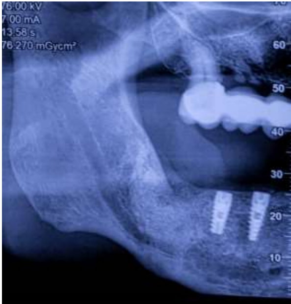
Figura 19: Hemiarcada mandibular derecha