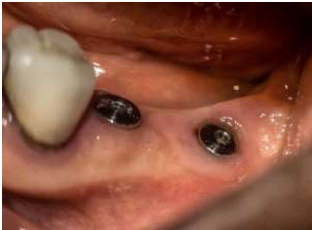
Figura 23: Hemiarcada mandibular izquierda

En la hemiarcada izquierda tanto superior como inferior se observa un panorama similar con una buena cicatrización de la encía y con implantes dentales que tienen un buen perfil de emergencia (figura 23, 24 y 25).