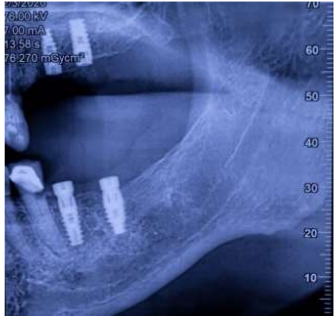
Figura 20: Hemiarcada maxilar y mandibular izquierda