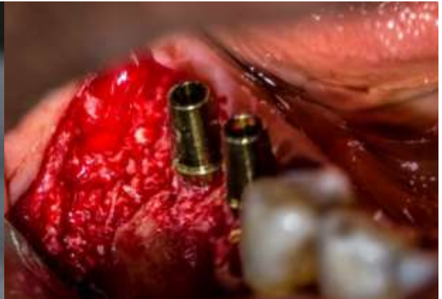
Figura 8: Colocación del injerto