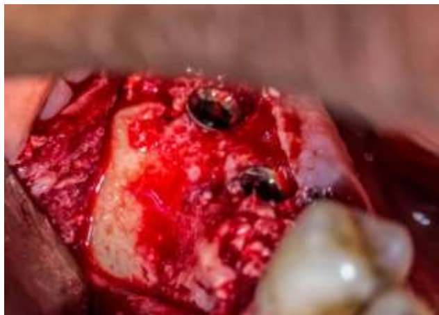
Figura 9: Implantes dentales 4.6 y 4.7