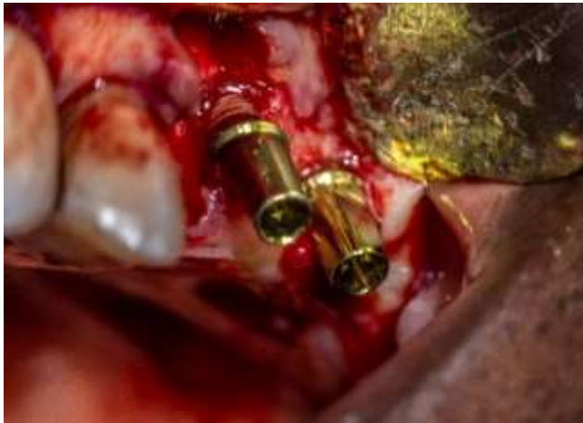
Figura 14: Implantes dentales 2.6 y 2.7

Posterior a la extracción se colocaron dos implantes que sustituyen a las piezas dentarias 2.6 y 2.7 para que el diseño protésico abarque hasta la pieza dentaria 2.5 (figura 14 y 15). También se colocó injerto óseo con la técnica sticky bone (figura 16) y se procedió a suturar (figura 17).