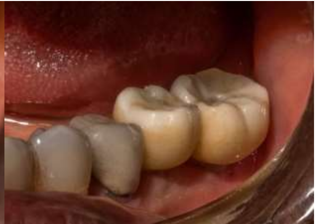
Figura 30: Coronas de zirconio 3.6 y 3.7