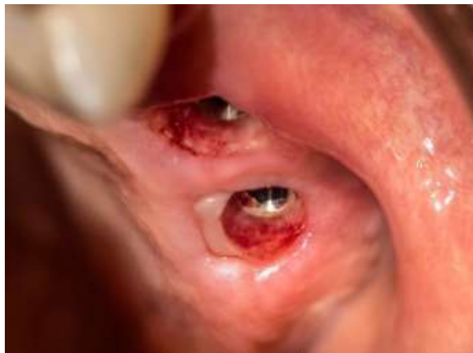
Figura 25: Perfil de emergencia piezas 2.6 y 2.7.