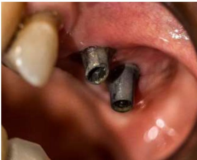
Figura 31: Implantes 2.6 y 2.7