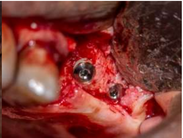
Figura 15: Implantes dentales 2.6 y 2.7