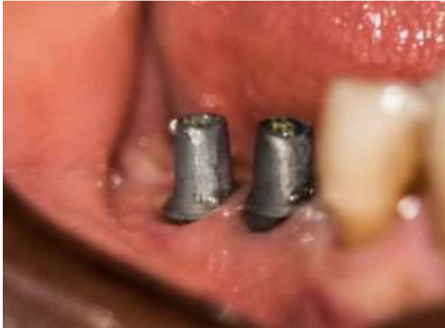
Figura 26: Implantes 4.6 y 4.7

Secuencia de prueba y cementación de las coronas de zirconio en la hemiarcada mandibular derecha (figura 26, 27 y 28).