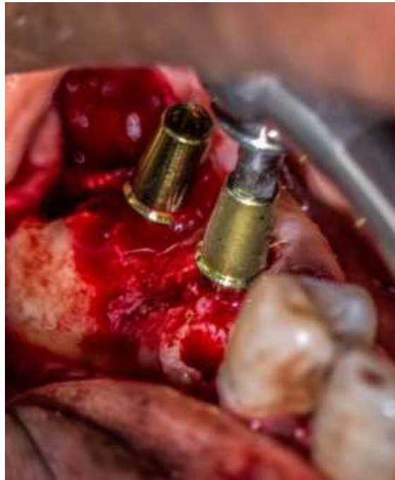
Figura 6: Colocación de implantes 4.6 y 4.7