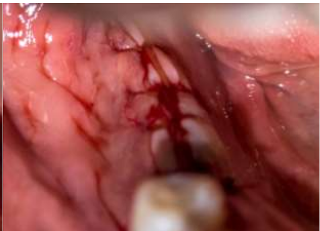
Figura 10: Sutura