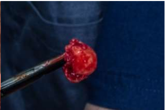
Figura 5: Remoción del QD conjuntamente con la pieza 4.8