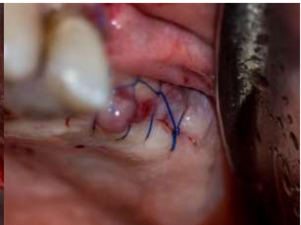
Figura 17: Sutura.