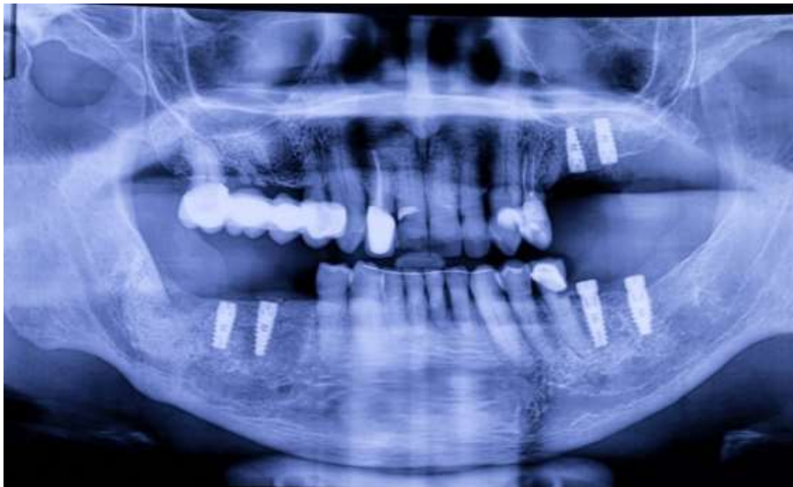
Figura 18: Radiografía panorámica

El día 10 de febrero del 2020 se cita al paciente para la evaluación clínica y radiográfica después de 10 meses posterior a la remoción del quiste y la colocación de los seis implantes dentales. El tiempo de espera se debió a que el paciente reside fuera de la ciudad y además por su edad se le complicaba viajar en un periodo de tiempo más corto. Dentro de la evaluación radiográfica es evidente la regeneración en el trabeculado óseo a nivel de la hemiarcada mandibular derecha en donde estaba ubicado el QD y el tercer molar retenido (figura 18 y 19) hay un aumento en la radiopacidad y no se observa indicio de algún tipo de recidiva. También se puede observar una buena oseointegración de los implantes 4.6 y 4.7 al igual que en la hemiarcada izquierda tanto del maxilar superior como de la mandíbula a nivel de los implantes 2.6; 2.7; 3.6 y 3.7 (figura 20).