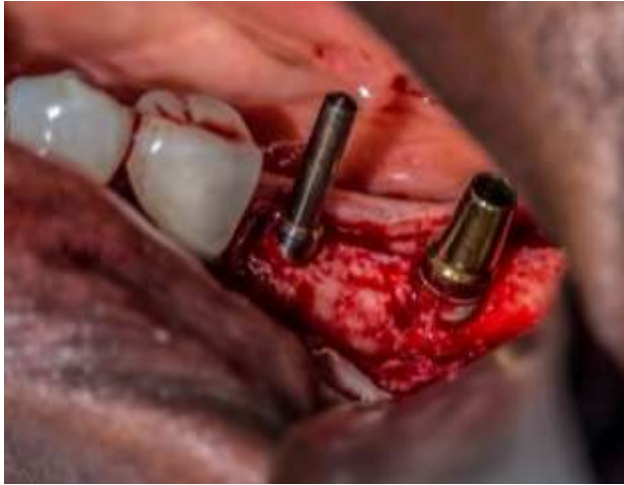
Figura 11: Implantes dentales 3.6 y 3.7