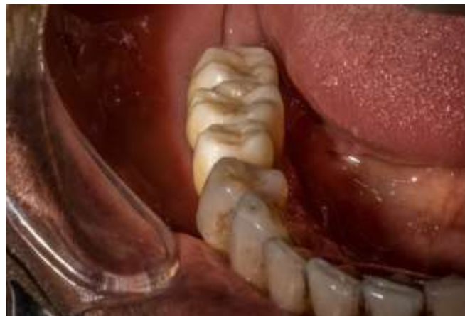
Figura 28: Coronas de zirconio 4.5; 4.6 y 4.7