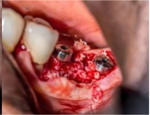
Figura 12: Implantes dentales 3.6 y 3.7 con injerto óseo.