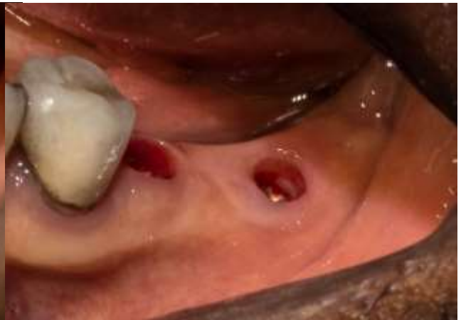
Figura 24: Perfil de emergencia de los implantes 3.6 y 3.7