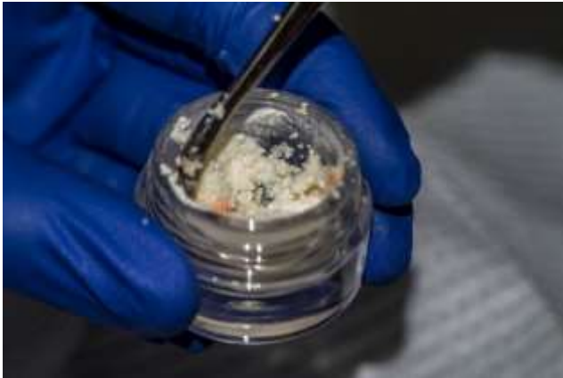
Figura 7: Aloinjerto particulado marca puros (casa Zimmer)