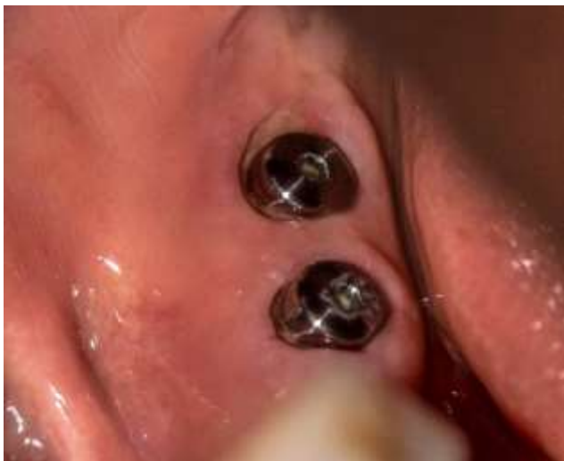
Figura 21: Hemiarcada mandibular derecha

Dentro de la evaluación clínica se observa una buena cicatrización de la encía a nivel de la hemiarcada derecha y los implantes dentales tienen un buen perfil de emergencia (figura 21 y 22).