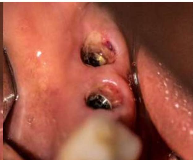
Figura 22: Perfil de emergencia de los implantes 4.6 y 4.7