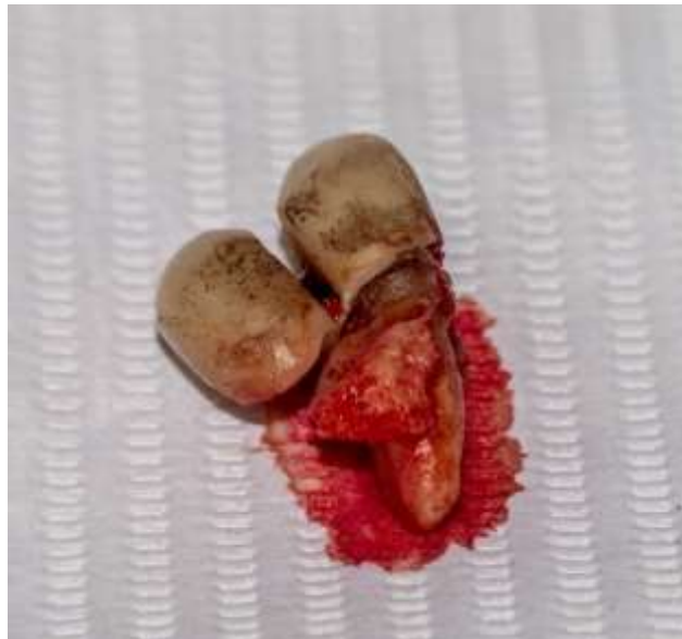
Figura 13: Pieza dental 2.4 con un diseño de prótesis fija en cantiléver.

El 25 de abril del 2019 se realiza la segunda cirugía en el maxilar superior en donde se optó por extraer la pieza 2.5 que tenía un diseño de prótesis fija en cantiléver (Figura 13).