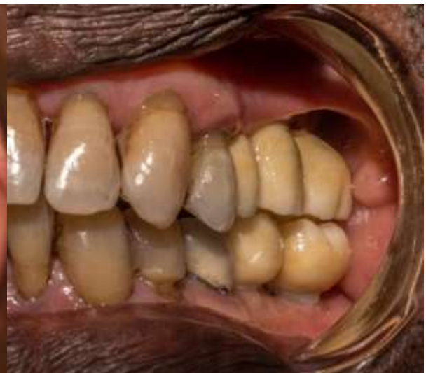
Figura 32: Coronas de zirconio 2.5; 2.6; 2.7; 3.6 y 3.7