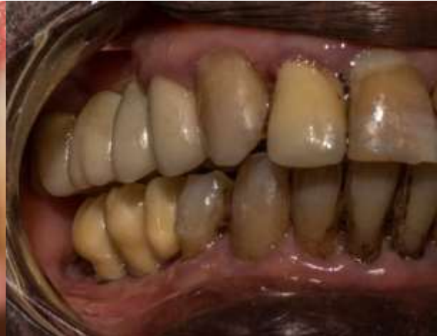
Figura 27: Coronas de zirconio 4.5; 4.6 y 4.7