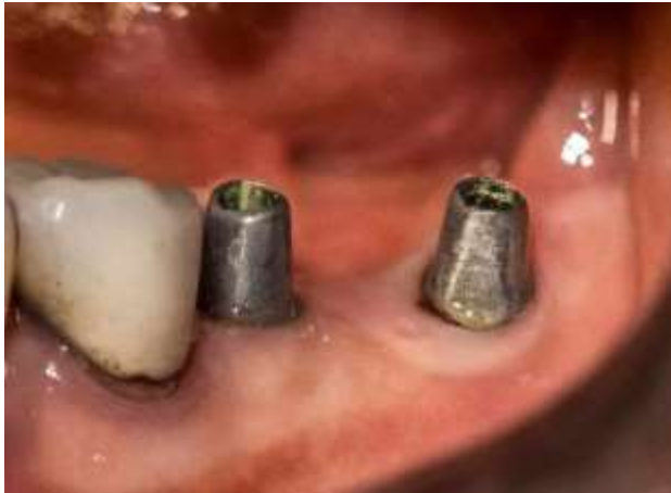
Figura 29: Implantes 3.6 y 3.7

Secuencia de prueba y cementación de las coronas de zirconio en la hemiarcada mandibular izquierda (figura 29 y 30) y en la hemiarcada del maxilar superior del lado izquierdo (figura 31 y 32), y control de la oclusión.