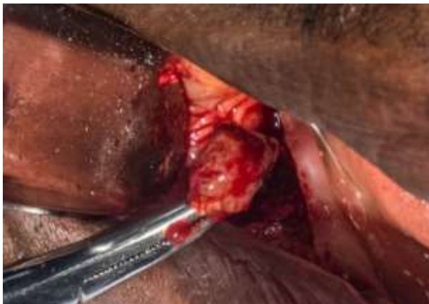
Figura 4: Remoción del QD conjuntamente con la pieza 4.8

El 10 de abril del año 2019 en la primera cirugía bajo anestesia local con lidocaína al 2% a nivel del nervio dentario inferior, se realizó un tratamiento conservador para eliminar el QD conjuntamente con el tercer molar retenido, es decir la pieza dentaria 4.8; consistió en una enucleación completa con curetaje (figura 4 y 5); además se realizó la extracción de la pieza 4.5 que presentaba una lesión apical, un tratamiento de conducto en mal estado, gran destrucción de la corona y parte cervical, cuyo pronóstico era desfavorable en cuanto a un tratamiento conservador.