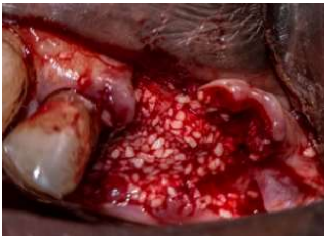
Figura 16: Injerto óseo (sticky bone).