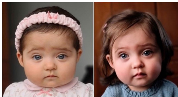
Figura 3 - A - B: Seguimiento clínico y radiográfico al año y 7 meses del procedimiento quirúrgico.

El seguimiento de la paciente ha sido de aproximadamente 1 año 7 meses tanto clínico como radiológico. Su situación actual es muy favorable, desde el punto de vista estético y funcional, pudiéndose observar simetría en la región frontal y en el tercio superior facial, altura de globos oculares al mismo nivel, evidenciando una mejora en su parte estética después del proceso quirúrgico. (Figura 4 A - B) En cuanto a su evolución neurológica, no presenta ninguna alteración.