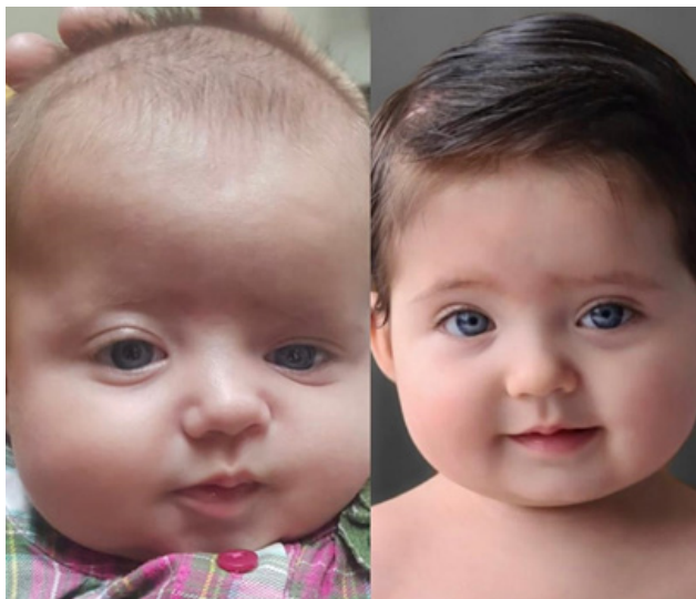
Figura 2 - Posteriormente se verifica que no exista ningún inconveniente y continua el proceso quirúrgico.

Se remodela y verifica movimientos oculares mediante pruebas de ducción forzada tanto para músculo recto superior y músculo recto inferior, observando que no exista atrapamientos de la zona.