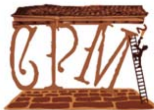
FIG. 05 IMAGEN REPRESENTATIVA CONSERVACIÓN PREVENTIVA, MONITOREO Y MANTENIMIENTO. AUTOR: JIRÁFICA / PROYECTO vir CPM