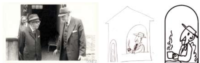
FIG. 04 DESARROLLO DEL PERSONAJE DE DON VÍCTOR. AUTOR: JIRÁFICA / PROYECTO vir CPM