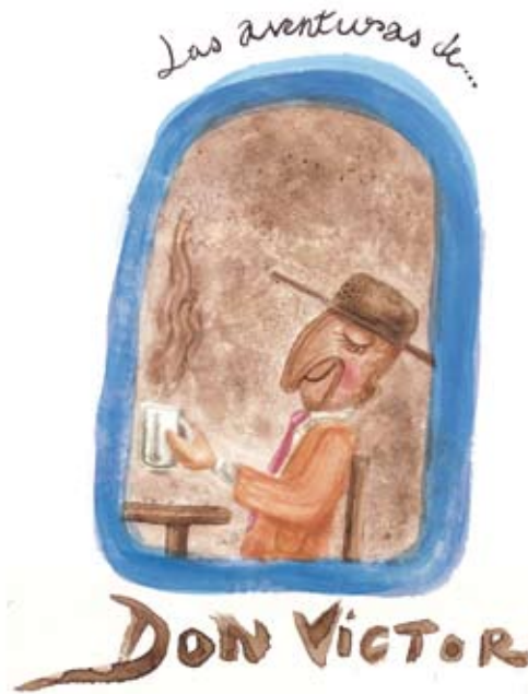
FIG. 01 PORTADA DE LA HISTORIETA LAS AVENTURAS DE DON VÍCTOR. AUTOR: JIRÁFICA / PROYECTO VIII CPM

investigación de nuestro proyecto, a la que se suma la convicción de que en un universo tan grande, sin el involucramiento de la comunidad es muy complejo establecer planes eficientes de gestión, ha sido uno de los factores que nos ha impulsado a desarrollar nuevas formas de interrelación con los habitantes, que nos permitan transmitir las ideas desde el área técnica y construir, de una manera conjunta, un mejor escenario para el trabajo a favor del patrimonio. A la historieta desarrollada, a manera de ejemplo y presentada en este documento, hay que sumar la generación de cartillas de monitoreo y mantenimiento, así como también los reportes, con responsabilidades compartidas entre técnicos y propietarios o en general, habitantes del patrimonio, instrumentos o herramientas de gestión que están en desarrollo en el proyecto.