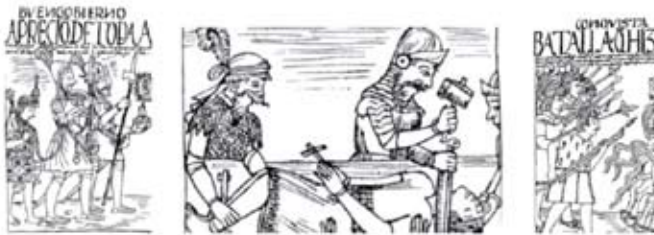
FIG. 02 CRÓNICAS DE LA CONQUISTA.

La opción escogida es la de desmitificar el mundo de la técnica para, de una manera cómica, atractiva, con recursos de lenguaje y la cultura local, acercarnos a la sensibilidad del ciudadano. El recurso expresivo ha explorado varias alternativas, optando finalmente por un concepto basado en la narración gráfica ecuatoriana de la cual tomamos dos referencias importantes: