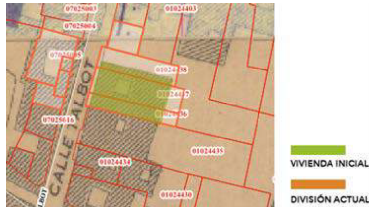
Figura 4. Planos de la Ciudad de Cuenca

abrieron los pisos de vigas de madera. En el interior se construyó un largo zaguán que permitía el acceso lateral a las habitaciones (figura 5). Cuando el inmueble pasa a poder de la actual propietaria, se incorporó una cubierta de vidrio con estructura de hierro como protección de las filtraciones de agua lluvia desde las cubiertas (figura 6).