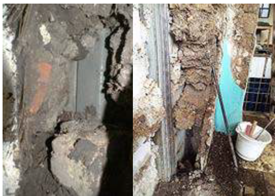
Figura 7: Muro norte socavado en primer y segundo nivel, 2017

El propietario del inmueble colindante norte introdujo en el primer tramo junto a la fachada frontal una estructura metálica en los dos niveles y tabiques de bloques de cemento. En este muro, la pared de adobe fue socavada en varias secciones; en la intervención se recalzó con adobe, ladrillo y mortero de barro; en planta alta del muro que fue de adobe, únicamente quedó el mortero de revoque, con secciones de los antiguos adobes. Durante la intervención se constató que este muro se ha convertido en muro de relleno y es la presencia de pilares en planta baja la que sustenta la estructura de la terraza (figura 7).