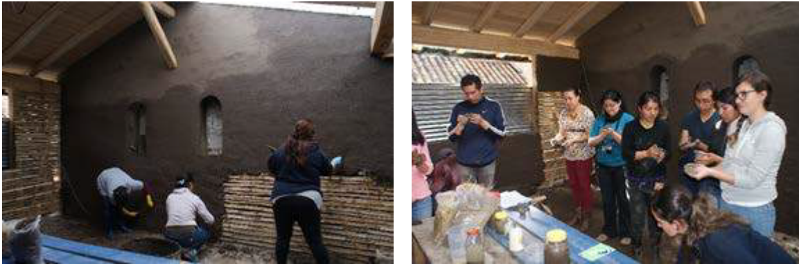
Figura 12. Taller de revoques, 2017

De manera conjunta con la Municipalidad de Cuenca, a través de la Dirección de Áreas Históricas y Patrimoniales, la Escuela Taller y la Red PROTERRA, se realizó un taller de capacitación de revoques de tierra que tuvo buena acogida. Estaba previsto inicialmente para 16 asistentes divididos en dos grupos de ocho participantes y planeado para desarrollarse en dos horarios: en la mañana y en la tarde; sin embargo, asistieron 36 personas (5 funcionarios municipales, 4 maestros albañiles de las parroquias rurales, 2 diseñadoras del interior, 2 amas de casa, 23 arquitectos jóvenes en libre ejercicio profesional y también estudiantes de arquitectura (figura 12).