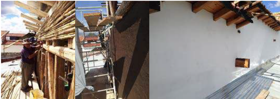
Figura 9. Intervención en muro de bahareque, pared sur

La nueva madera utilizada es eucalipto, previamente tratada con un químico marca kimocide para proteger de polillas e insectos. Para la consolidación del tejido de soporte del barro, se usó carrizo nuevo en el lado externo de las paredes y caña guadua en el interior; de esta manera, se disminuyó el peso del barro, obteniendo a la vez tabiques de menor sección (figura 9).