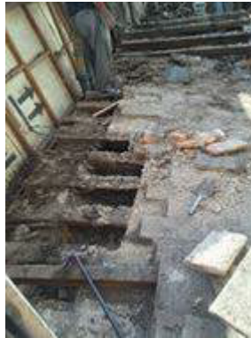
Figura 11. Estado de la estructura de terraza en momento de la intervención, 2017

Se mantuvo el sistema de cantoneras, vigas, ladrillos y se incorporó una malla de hierro de 15x15cm y una capa de hormigón alivianado de 4 cm para posteriormente colocar ladrillo, similar al utilizado como acabado final (figura 11).