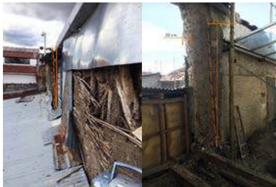
Figura 8. Pared sur de bahareque, antes de la intervención, 2017.

Las paredes medianeras de bahareque en el segundo piso no tuvieron mantenimiento, encontrándose pudrición de la madera y el carrizo a pesar de contar con planchas de zinc para detener los daños, protección que no fue suficiente. Detrás de estas láminas, el barro y el carrizo estaban sueltos y podridos; la madera se había suelto de sus anclajes y, en el tramo que da hacia la fachada, el inmueble no contaba con paredes medianeras, ni paredes propias porque las paredes de bahareque estaban asentadas sobre la solera de madera del vecino (figura 8).