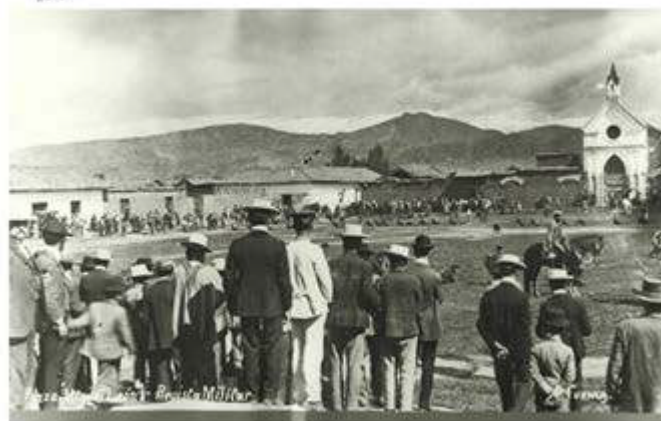
Figura 3. Plaza y alrededores del barrio de San Sebastián

En la actualidad, este barrio conserva la arquitectura vernácula popular con viviendas de una y dos plantas; sin embargo, los usos y la materialidad están siendo transformadas negativamente, razón por la cual este proyecto pretende ser un aporte por el ejercicio de las tradiciones constructivas locales y demostrar que es posible la conservación del patrimonio así como mantener el uso de vivienda en condiciones de dignidad.