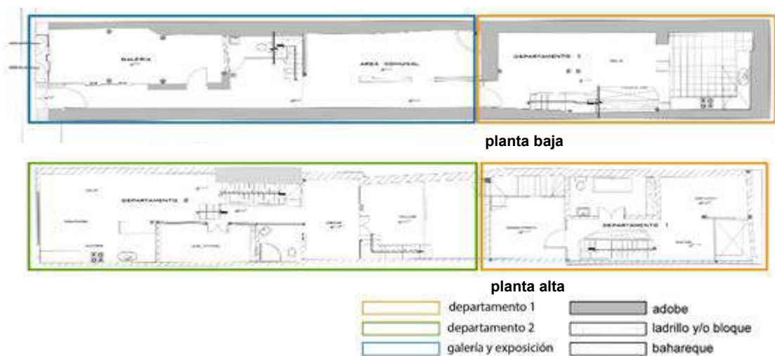
Figura 2. Proyecto arquitectónico, 2017 (Fuente: Lourdes Abad)