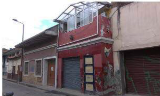
Figura 6: Estado del inmueble antes de la intervención, 2016

La tipología constructiva tradicional, al principio de la subdivisión del inmueble se mantuvo; se conservaron muros de adobe y bahareque. Posteriormente se encontró adaptaciones para dar cabida a dos viviendas y un local comercial. Se construyeron agregados de bloque de cemento, se suprimieron paredes de bahareque y, además, se reciclaron materiales dando forma a un inmueble que poco a poco se fue modelando en una austera edificación, con ventilación e iluminación deficientes.