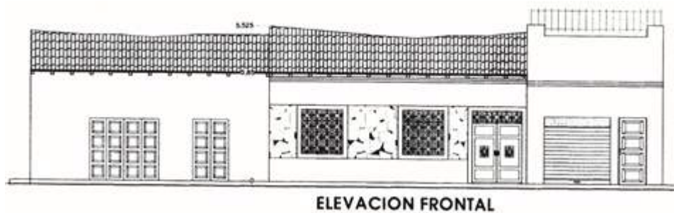
Figura 5. Fachada de los inmuebles que fueron una sola unidad, 2008