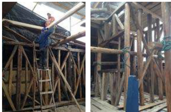
Figura 10. Paredes nuevas de bahareque, 2017

Se construyeron nuevas paredes de bahareque en el segundo piso, en el tramo de la fachada, con el sistema de “cruz de San Andrés” (figura 10).