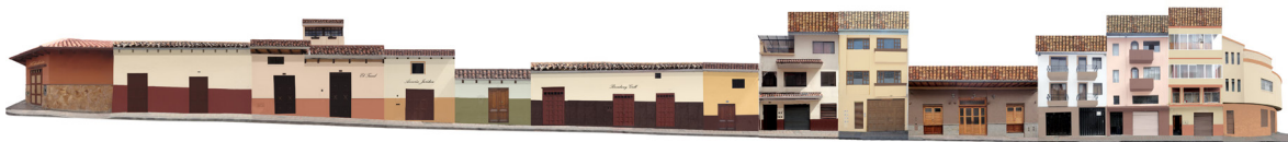
Fig. 5: Estado actual y propuesta de color en un tramo circundante al edificio de la Alianza Obrera del Azuay.