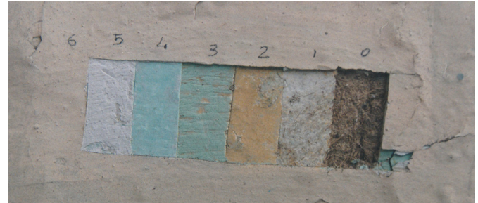
Fig. 1: Cala en edificación de la calle Mariano Cueva 4-22 entre calle Larga y Honorato Vázquez.

Al mismo tiempo, se seleccionaron seis muestras de revestimiento de muro para ser analizadas