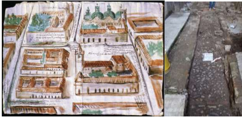
Figura 1 y 2. A la izquierda: Fundación El Barranco, 2008, Boceto de 1729 de Manuel Núñez Cruz con la evidencia de la existencia del templo de los Jesuitas y de la acequia en la actual Calle de Santa Ana, 1729 , Mapoteca del Archivo Nacional de Historia Quito. Planos e imágenes. A la derecha: Informe Arqueológico de la Calle de Santa Ana, Pavimentos empedrados descubiertos por el Dr. Jaime Idrovo Urigüen .