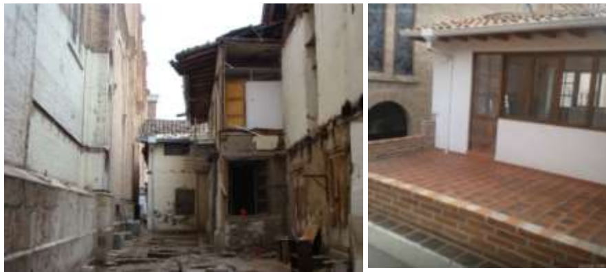
Figura 6 y 7. A la izquierda: Proyecto vIirCPM,

El redoblado empeño por 'inaugurar la calle' como si se tratase de una generosa donación (nótese que la campaña política electoral de 2017 estuvo ya activada), indujo a una serie de acciones precipitadas, de estudios de dudosa idoneidad, de nuevos contratos y, lo más lamentable, de inadmisibles actitudes profesionales de técnicos y "gestores culturales" que no dudaron en poner su palabra en la dirección de conveniencia: dar la razón al poder. Sobre la polémica estructura de la calle (la denominada 'casa') no se ahorraron opiniones, una sola dirección se alineó desde la oficialidad y coincidió con la eliminación de la estructura, pues se utilizó a los medios, a la ciencia, a la historia y a la cultura, para aupar la palabra del político. La calle fue 'inaugurada' en dos ocasiones, en medio controversias entre las instituciones que financiaron el proyecto, y se ofrecieron soluciones para la polémica estructura sobre la base de informes e indagaciones que fueron ejecutadas por las mismas instituciones involucradas en este proceso. Ni las decisiones ni su argumentación han sido discutidas o comentadas con el equipo consultor que estuvo al frente del proyecto desde el año 2010.