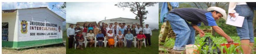
Imagen 2. 2a. Primeras aulas de la UVI-Selvas en la comunidad de Huazuntlán (Mecayapan). 2b. Acto de graduación de la primera generación de egresados/as de la LGID de la UVI-Selvas. 2c. Proceso colectivo de investigación comunitaria vinculada y colaborativa con enfoque intercultural

Fuente: Imágenes facilitadas por cortesía de Hernández Luis 2013, 77. Elaboración: Propia.