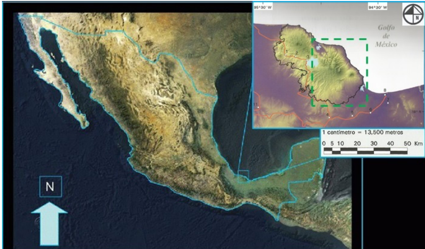
Mapa 1. Localización geográfica de la Sierra de Santa Marta

Fuente: (Guevara, Laborde y Sánchez-Ríos 2004). Elaboración: Propia.