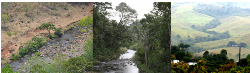
Imagen 1. El antes y el después de la implementación de las prácticas socioterritoriales alternativas de restauración ambiental no gubernamentales en algunos predios de la Sierra de Santa Marta