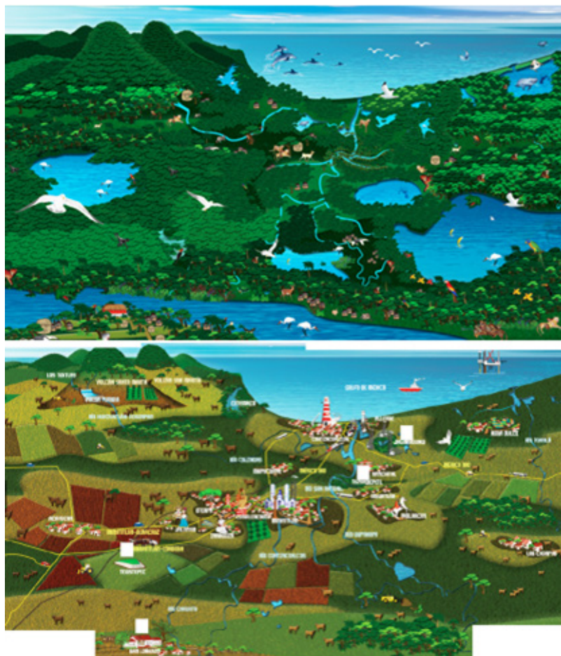
Figura 1. Evolución de los paisajes socioterritoriales tradicionales y de los recursos naturales endógenos en el ámbito geográfico de la Sierra de Santa Marta y el SE del Estado de Veracruz