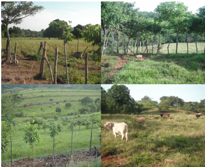
Imagen 4. Predios de los/as campesinos/as beneficiarios/as del apoyo de ENDESU A.C.