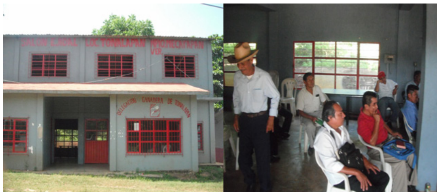
Imagen 3. Asamblea de los proyectos DECOTUX y CICATH