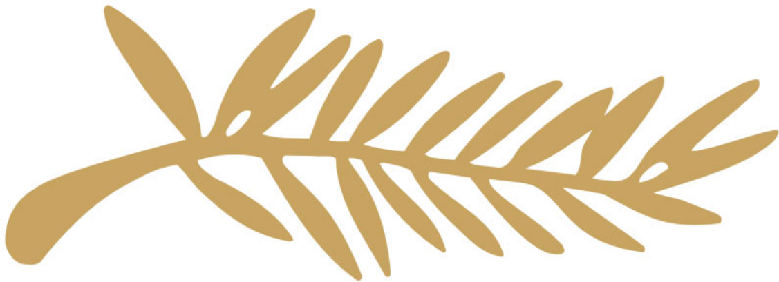
Palma de Oro. Logo del Festival de Cannes.

sea por los materiales, la producción y la forma de consumo. Efectivamente, el festival de cine y su estudio refiere a un espacio transnacional en el que sobresale principalmente Cannes (Mazdon, 2006).