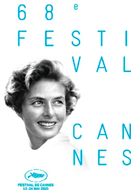
Afiches del Festival de Cannes: 1ª edición (1946) y 68ª edición (2015).

Antes de continuar, una breve digresión sobre los mecanismos de selección que permitirá dilucidar nuestro planteamiento respecto del cine contemporáneo. Varios trabajos han señalado los cambios producidos a nivel organizativo-estructural en el Festival de Cannes luego de Mayo 68 (Campos 2018; De Valck