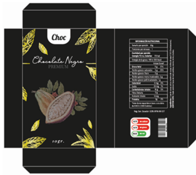
Diseño de packaging concepto premium