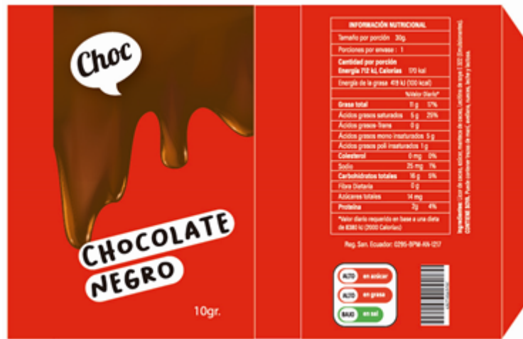
Diseño de packaging concepto estándar