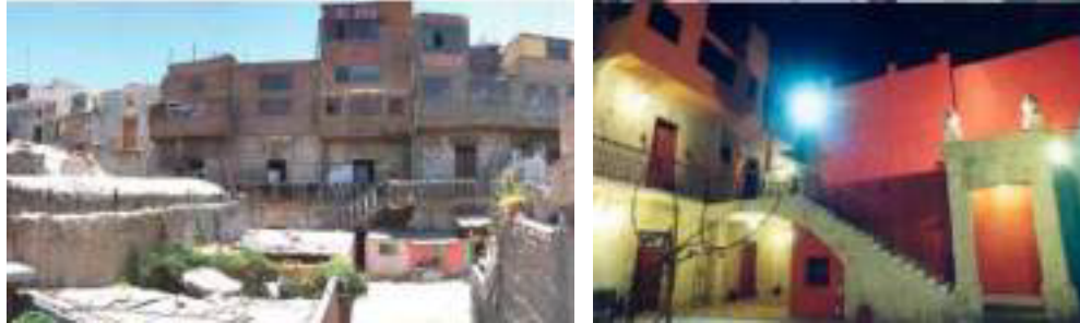
Figura 3: Antes y después de la intervención en Tambo El Matadero (Aspilcueta, 2009, p.95)

En el 2000 el Centro Histórico de Arequipa fue declarado Patrimonio Mundial, teniendo como mérito su unidad urbanística otorgada por su arquitectura doméstica (Aspilcueta, 2009).