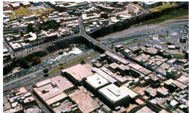
Figura 2: Vista aérea del Puente Bolognesi y el río Chili, Arequipa, Perú