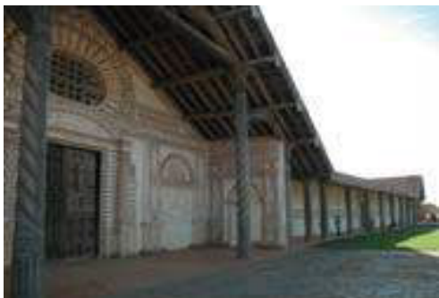
Figura 7: Iglesia barroca de San Xavier (AECID, 2010, p.15)

Las misiones eran concentraciones de tribus nómadas, fundadas por misioneros jesuitas en los siglos XVII y XVIII. Aún conservan las tipologías de pueblo misional, así como su arquitectura, sus templos y su urbanismo republicanos, con lo cual en 1990, fueron declarados Patrimonio de la Humanidad.