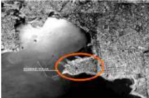
Figura 4: Ciudad Vieja, Uruguay (Hegoburu, 2009, p.49)