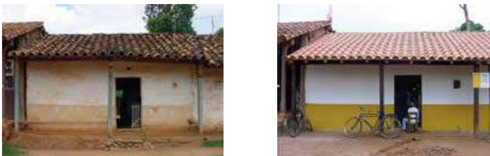
Figura 9: Intervención en una de las edificaciones, dentro del Plan Vivienda en Concepción (AECID, 2010, p.91)

El municipio, la comunidad, los beneficiarios y el personal del Plan, también conformaron una minga para la mejora del espacio público, con la implementación de mobiliario, señalética y reforestación. Adicionalmente, se impulsó un proyecto de recuperación de artesanías tradicionales, formando a los nuevos detentores de estos saberes, para la producción de autoconsumo y exportación de productos y manifestaciones del patrimonio cultural del sitio. (Vargas, 2014)