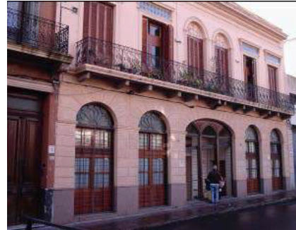
Figura 5: Arquitectura Patrimonial Ciudad Vieja. (Hegoburu, 2009, p.53)