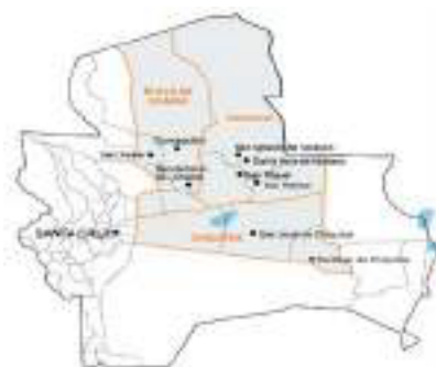
Figura 8: Provincias y secciones de Provincia del Departamento de Santa Cruz (AECID, 2010, p.13)