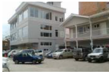
Figura 11: Barrio El Vado, Cuenca - Ecuador. (Proyecto vIirCPM, 2015)

Otra problemática similar al caso del Centro Histórico de Cuenca está dada en el área patrimonial de Ciudad Vieja, en la cual la población residente original disminuye, recibiendo