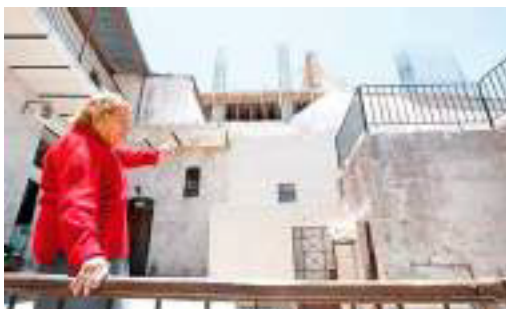
Figura 10: Barrio del Solar. Arequipa - Perú (Rodríguez, 2013)

En las siguientes imágenes se puede visualizar la problemática mencionada en los casos Perú – Ecuador, donde se observa en la figura 10, en el contexto de Arequipa (Perú), la construcción de un hotel de más de 5 pisos en una zona en la cual predominan edificaciones de dos pisos de altura. De igual manera en la figura 11, en el contexto Cuenca (Ecuador), se puede ver la construcción de un edificio que irrespeta ordenanzas y desplaza usos tradicionales.