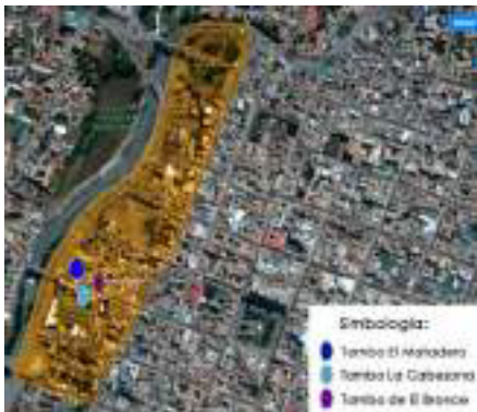
Figura 1: Vista aérea Barrio del Solar, Arequipa, Perú

El proyecto renovación de los Tambos de Arequipa surge del Plan Maestro del Centro Histórico de Arequipa, tras el terremoto del 2001, a través de la gerencia de este Centro Histórico con el apoyo de la Agencia Española de Cooperación Internacional para el Desarrollo (AECID). Esta estructura organizacional incluyó a la Comunidad del barrio El Solar (Aspilcueta, 2009)