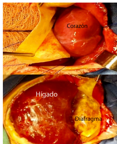
Imagen 2. Cierre del defecto diafragmático y esternal con parche protésico de pericardio bovino.