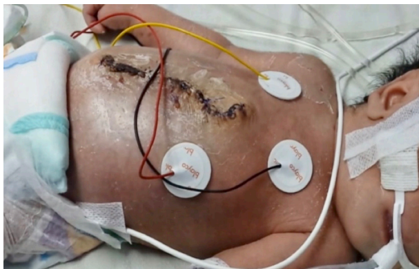
Imagen 3. Se observa abdomen y parte baja de esternón tras cierre definitivo durante al día 17 de vida.