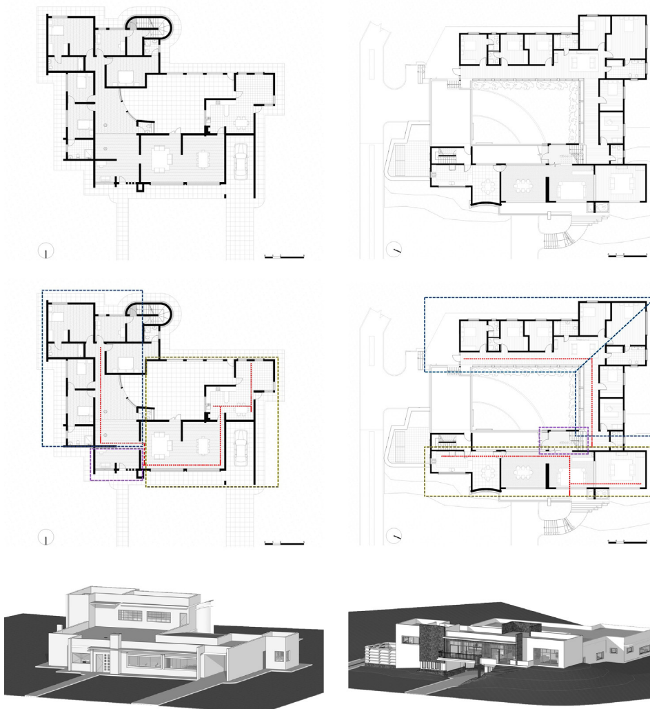
Figura 3. Planta, esquema funcional y volumetría de la Casa Peña (izq.) y la Casa Vázquez (der.)

De Proyecto TED, (2019); Carvallo-Ochoa, (2019).