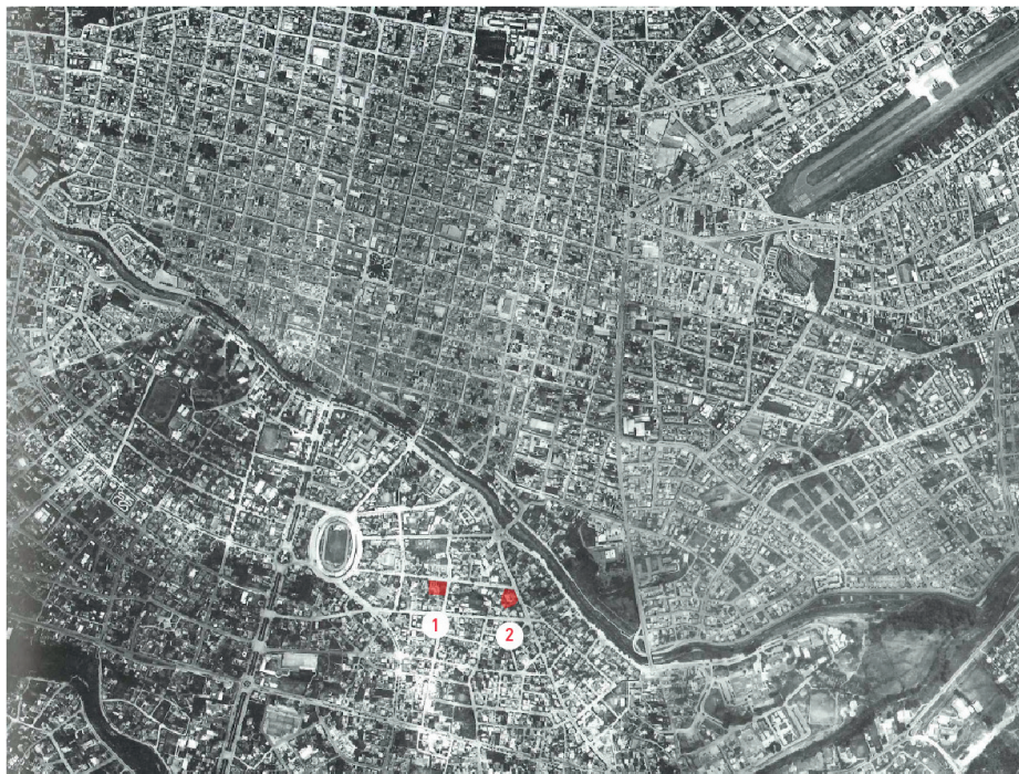
Figura 1. Foto aérea de la ciudad de Cuenca, de 1979: Ubicación de la Casa Peña (01) y la Casa Vázquez (02)