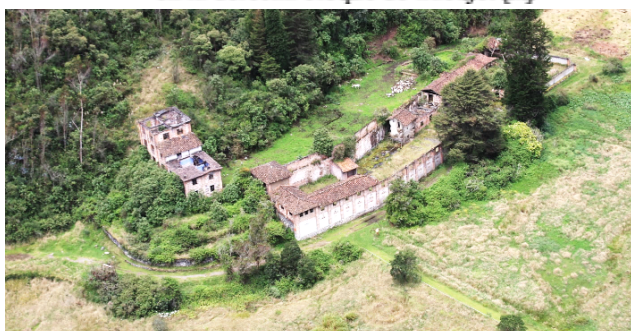
Figura 4: Vista aérea, hacia la izquierda bloque vivienda, en la derecha bloque de trabajo. [1]