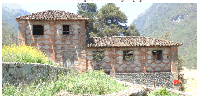
Figura 2: Cromática en muros y cimentaciones de piedra -Bloque de trabajo. [1]