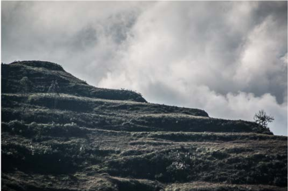
Figura 6. Cerro Monjas, terrazas.

En el área rural encontramos el sitio denominado Cerro Monjas (figuras 6 y 7) que se localiza a 4 km de Pumapungo, en dirección suroeste. A nivel superficial se localizan fragmentos cerámicos, además de presentarse en la parte sur de la colina a manera de terrazas, que manifiestan una forma piramidal. Por otra parte, en la parte superior del cerro se conserva una plataforma que conecta dos montículos trabajados, con evidencia cerámica. Al sur del cerro Monjas se encuentra otra elevación conocida como Boquerón, la cual es considerada como parte integral de la geografía sagrada y que se mantiene en la memoria de la comunidad.