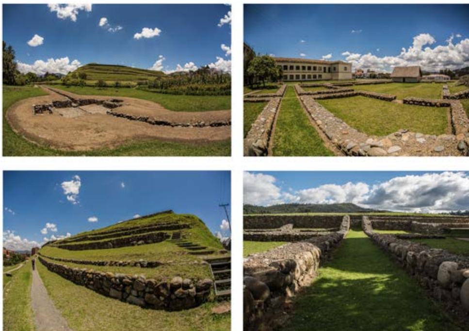
Figura 3. Estructuras del sitio arqueológico Pumapungo. Arriba, izquierda: canales de riego; arriba, derecha: posibles viviendas/kallancas; abajo, izquierda: terrazas; abajo, derecha: acceso al Qorikancha.