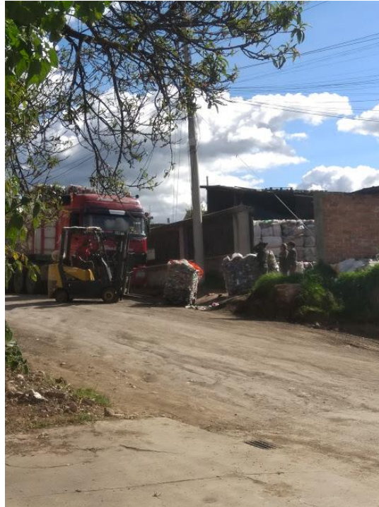
Fotografiado por Bryan Loja (13 de abril de 2021)