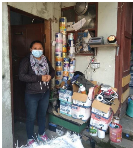
(13 de abril de 2021)

Al volver a la planta de Totoracocha, casi un año después, con tristeza no se pudo localizar o reconocer a Ellie y Mary. En su lugar se trató de abordar a más recicladores, dicho sea de paso, en las observaciones se vio una gran mayoría de participación de mujeres en esta