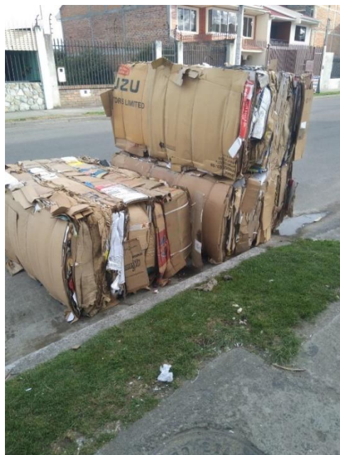
Fotografiado por Bryan Loja (16 de marzo de 2020)