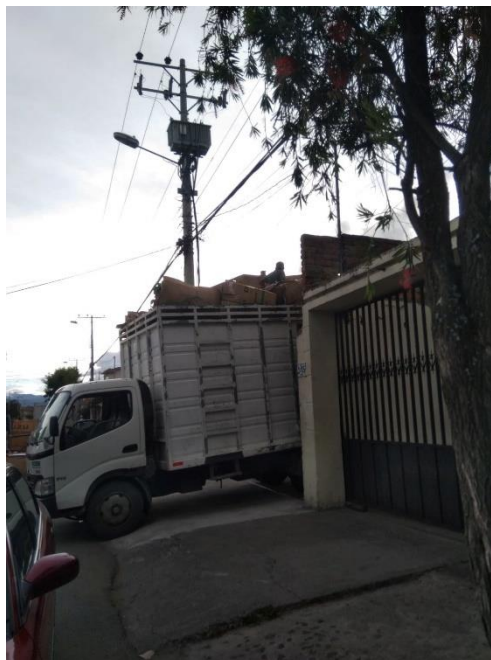
(16 de marzo de 2020)