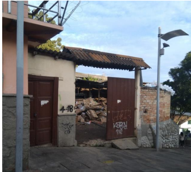
(13 de abril de 2021)