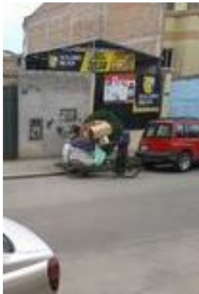
Fotografía por Bryan Loja (15 de agosto del 2020)

Pese a la asistencia recibida por la institución o los profesores, se sabe que aún con la educación virtual, la educación en pandemia ha supuesto una baja al nivel educativo y lo que es peor en muchos de casos de vulnerabilidad como este. El acceso a la educación virtual es difícil, al grado de inexistente, debido a, aparte de la falta de recursos, la edad de Blanca y la poca educación de su hija, la cual también trabajaba desde temprana edad, 12 años aproximadamente. Es entonces que, la dependencia de muchos niños y demás causas expuestas y otras presentes a lo largo de la vida de esta familia, genera esta condición de estratificación baja, y posiblemente de continuación de esta condición por las condiciones sociales, económicas y educativas.