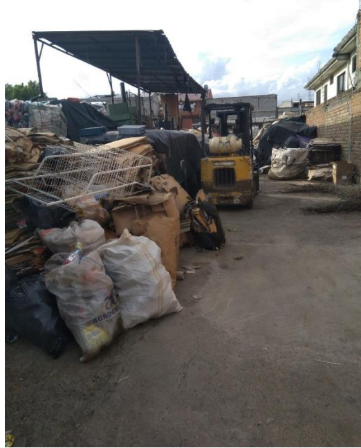
Fotografiado por Bryan Loja (16 de marzo de 2020)