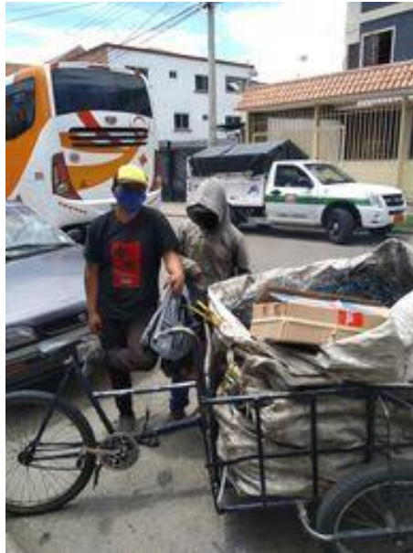
(29 de octubre de 2020)