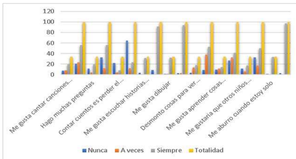
Ilustración 2. Cuestionario de creatividad dimensión de interés

Elaboración: Propia del autor. Fuente: Encuesta aplicada a 34 estudiantes del séptimo año de Educación General Básica de la Unidad Educativa Rafael Astudillo del cantón San Lorenzo recinto Colón Eloy