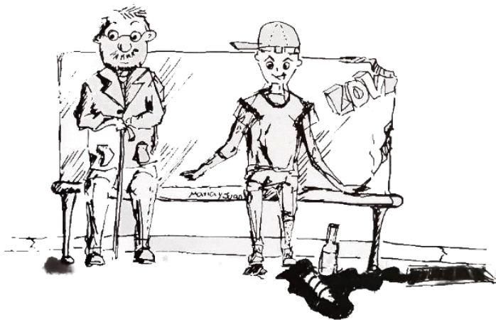
Imagen 2 Narrativa / sentido de uso del espacio público

Esta narrativa expresa los discursos de los habitantes de los espacios en los cuales la idea de “imagen estética” y “seguridad” son recurrentes para considerar a un lugar como un espacio habitable.