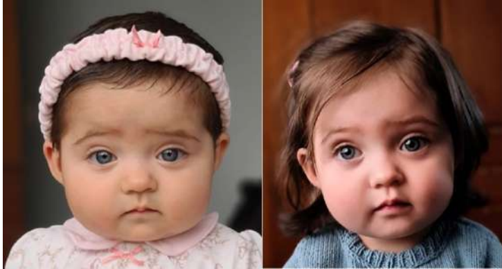
Figura 3 – Derecha – Tomografía inicial. Izquierda - TAC de cráneo 3D previo al alta, la cual demuestra la adecuada resolución