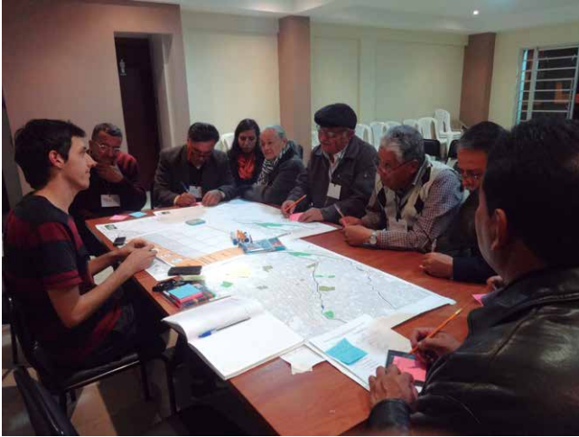
Talleres de participación ciudadana.