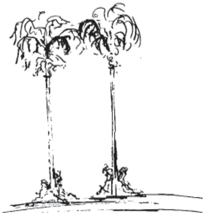
Fragmento de palmas «arquitectónicas».