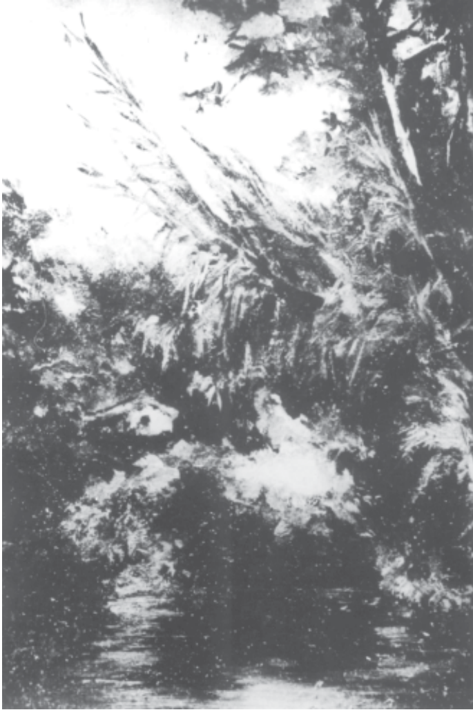
Paisaje expuesto en 1940, que se dice firmado al dorso «J.J.Mío».