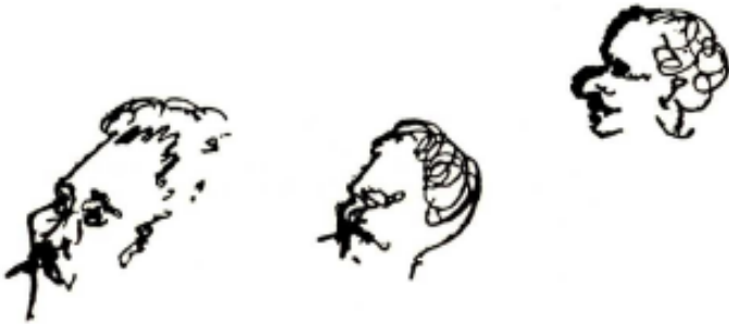
Tres autorretratos juntos.