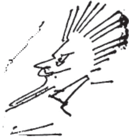
Dibujo del Tío Sam.