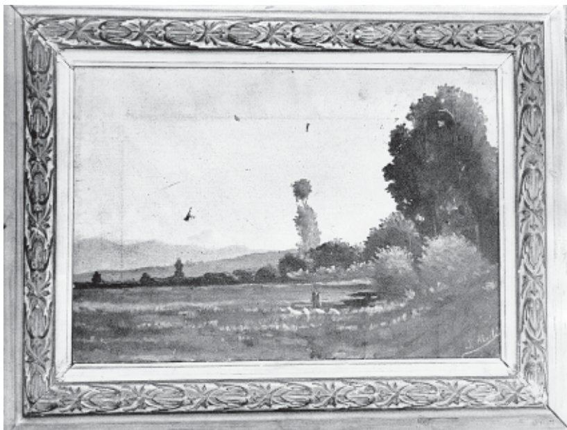
Paisaje que se exhibe en la Sala de las Banderas. (Fotografía de 1969, cortesía del Archivo del periódico Granma.)