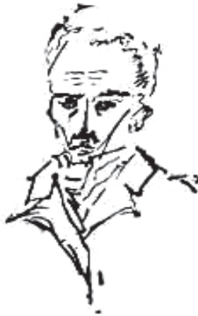
Retrato de Bolívar.