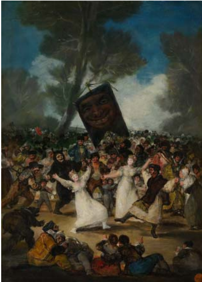
Francisco de Goya: El entierro de la sardina, óleo/tela.