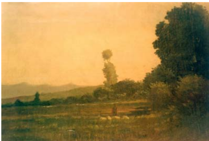
Versión en colores. (Fotografía de 2001, cortesía de la Oficina del Historiador de la ciudad de La Habana.)