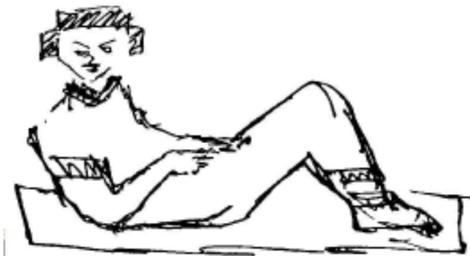
Autorretrato inspirado en el Chac Mool.