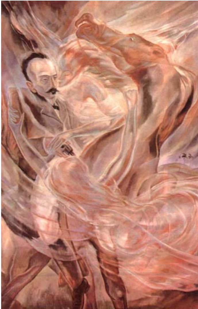
Carlos Enríquez: Dos Ríos, óleo/tela, 1939.