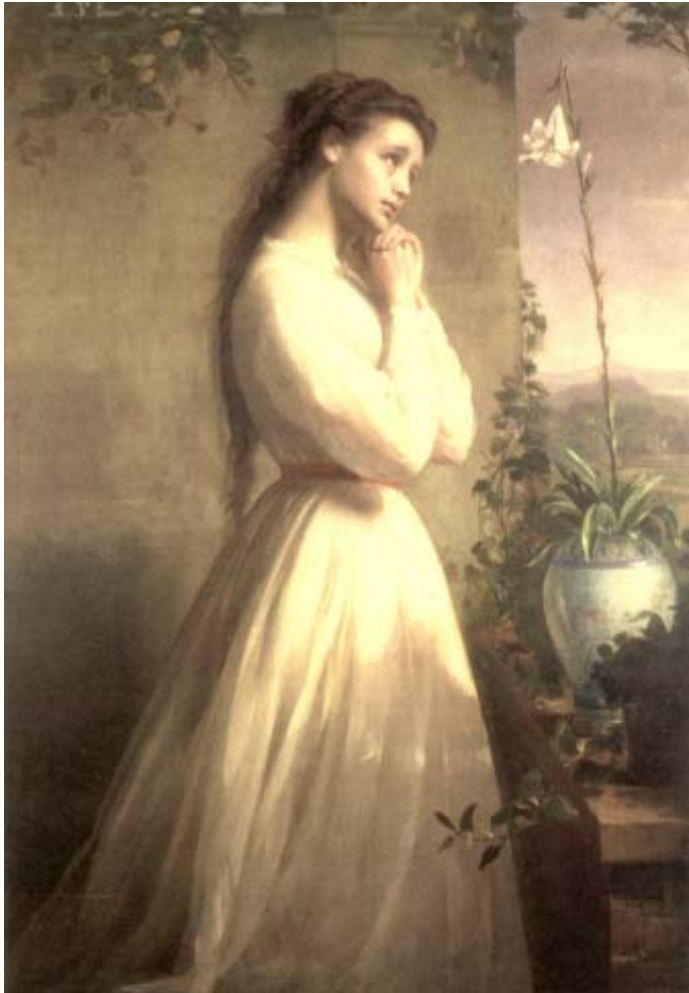
Manuel Ocaranza: El lirio roto.