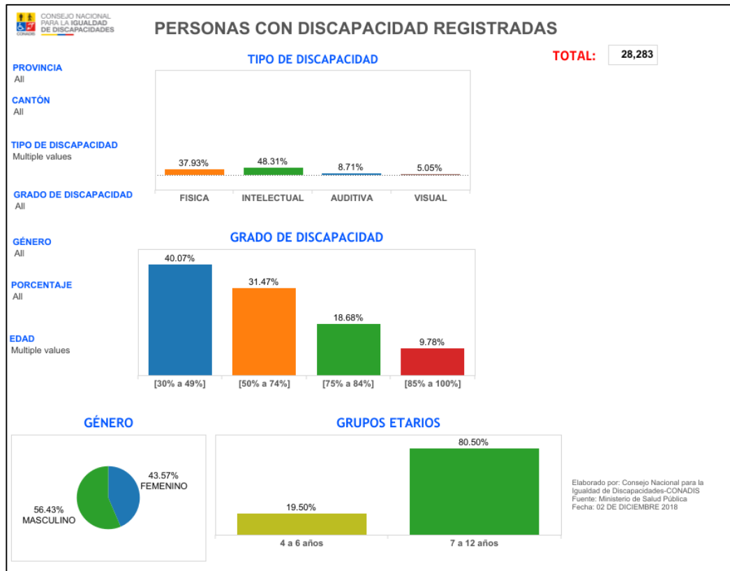
CONSEJO NACIONAL para la Igualdad de Discapacidades CONADIS. 2018. Personas con Discapacidad Registradas . [Tabla]. Recuperado de: https://www.consejodiscapacidades.gob.ec/wp-content/uploads/downloads/2018/03/index.html

A continuación, se plantearán estrategias para la adaptación curricular de estudiantes que padezcan discapacidad intelectual y discapacidad física pues son los tipos de discapacidad que priman de acuerdo a las estadísticas realizadas por el CONADIS.