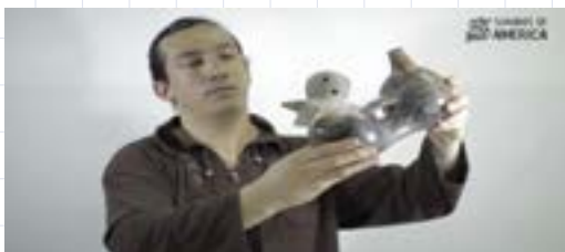
Referente artístico: Galería de Sonidos Prehispánicos. Obra: Botella Silbato de agua, (2017)

Recursos: plastilina, arcilla, goma, papel, botellas.