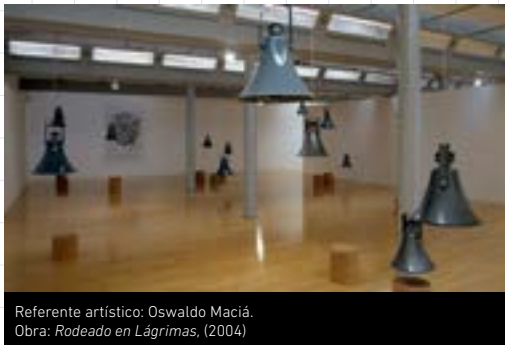
Referente artístico: Oswaldo Maciá. Obra: Rodeado en Lágrimas, (2004)

Recursos: papel o cartulinas, lápiz, pintura, escribir el sonido.