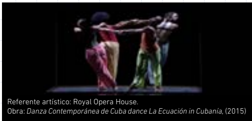
Referente artístico: Royal Opera House. Obra: Danza Contemporánea de Cuba dance La Ecuación in Cubaña , (2015)