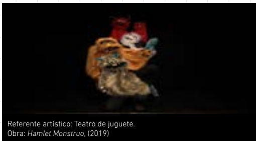
Referente artístico: Teatro de juguete. Obra: Hamlet Monstruo, (2019)