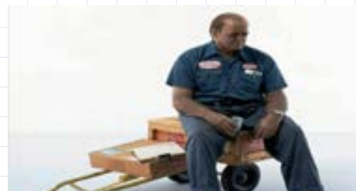
Referente artístico: Duane Hanson Obra: Delivery Man, (1980)

Recursos: objetos de la casa para disfrazarse: mandil, pizarra, pinzas guantes, etc.