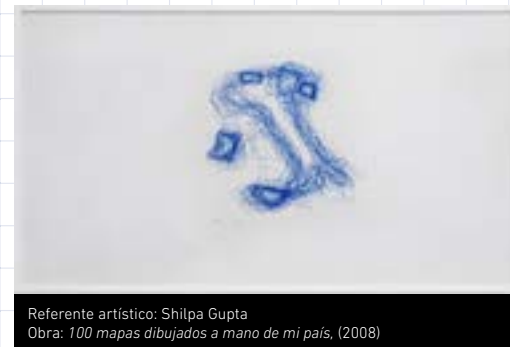
Referente artístico: Shilpa Gupta Obra: 100 mapas dibujados a mano de mi país , (2008)

Recursos: papel, cartulina, lápices de colores o marcadores.