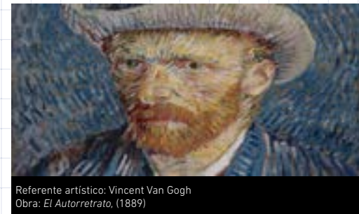
Referente artístico: Vincent Van Gogh Obra: El Autorretrato, (1889)

Recursos: papel aluminio o cucharón, lápices, marcadores o témperas.