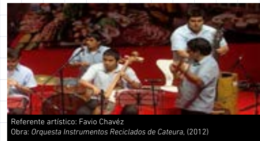
Referente artístico: Favio Chavéz Obra: Orquesta Instrumentos Reciclados de Cateura , (2012)

Recursos: rollos de papel, cartón, tachos vacíos, pintura, pincel, tijera, granos secos.