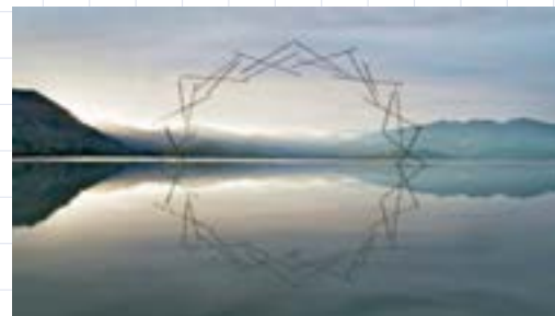
Referente artístico: Martin Hil. Obra: Synergy, (2009)

Recursos: palos, hojas, piedras, pegamento, cartulina, pincel, pintura.