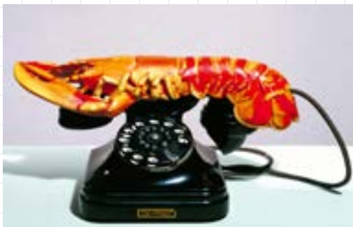
Referente artístico: Salvador Dalí. Obra: Lobster Telephone, (1938)

Recursos: plastilina, pintura, papel, objetos del hogar.