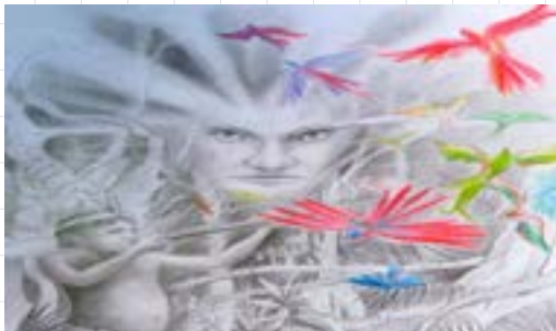
Referente artístico: Xavier Ocampo. Obra: Etsa y el demonio Iwia , (2014)

Recursos: botellas, envases desechables, cubetas de huevos, bolsas de papel, pegamento, pinceles, témperas.