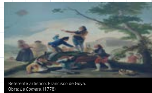
Referente artístico: Francisco de Goya. Obra: La Cometa , (1778)

Recursos: papel periódico, palos de chuzo, hilo, pinturas.