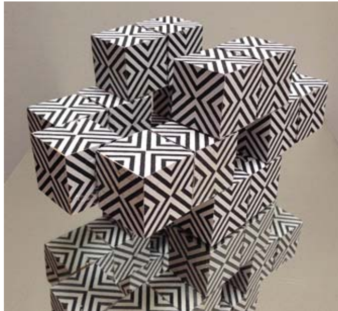
Figura 1. Josué Calle, 2015. Súper módulos con reflexión y textura.

A continuación se muestran imágenes de maquetas realizadas por alumnos de la carrera de Diseño de la Universidad de Cuenca que son el resultado del proceso creativo y del manejo teórico de la metodología de diseño.