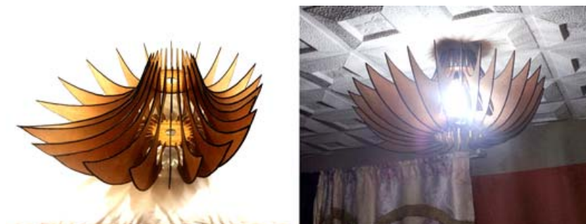
Figura 2. Andrés Muñoz, 2015. Planos en serie.