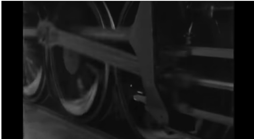
Imagen N° 11.- Fotograma de Monsieur Verdoux / Charles Chaplin (1947)

PELÍCULA REFERENTE: Monsieur Verdoux / Charles Chaplin. (1947)