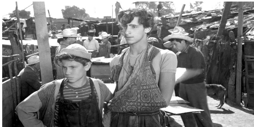
Imagen N° 10 .- Fotograma de Los Olvidados / Luis Buñuel (1950).

PELÍCULA REFERENTE: Los Olvidados / Luis Buñuel (1950)