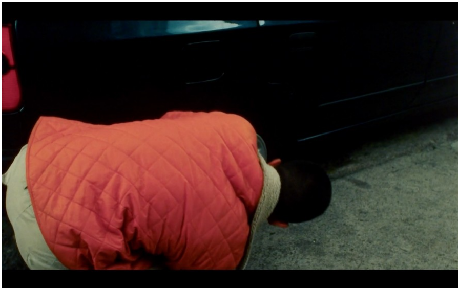
Imagen N° 13.- Fotograma de Ratas, Ratones y Rateros / Sebastián Cordero (1999).

PELÍCULA REFERENTE: Ratas, Ratones y Rateros / Sebastián Cordero (1999).