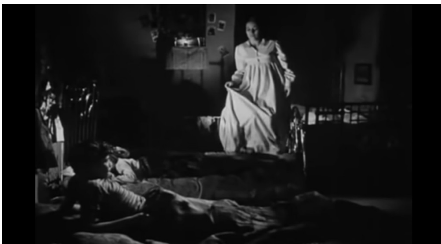
Imagen N° 12.- Fotograma de Los Olvidados / Luis Buñuel (1950)

PELÍCULA REFERENTE: Los Olvidados / Luis Buñuel (1950).