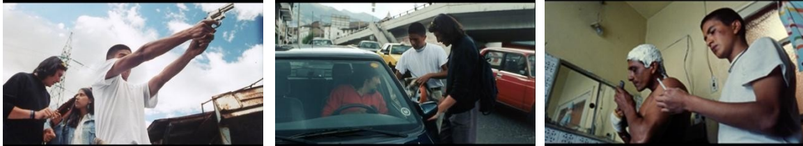
Ratas, ratones y rateros (1999), Sebastián Cordero.

embargo, esto no se hizo con la intención de una crítica social per sé a nivel dramático; pues vale destacar que la construcción del antihéroe se consolida en el cuestionamiento de la moral y la ética de las sociedades.