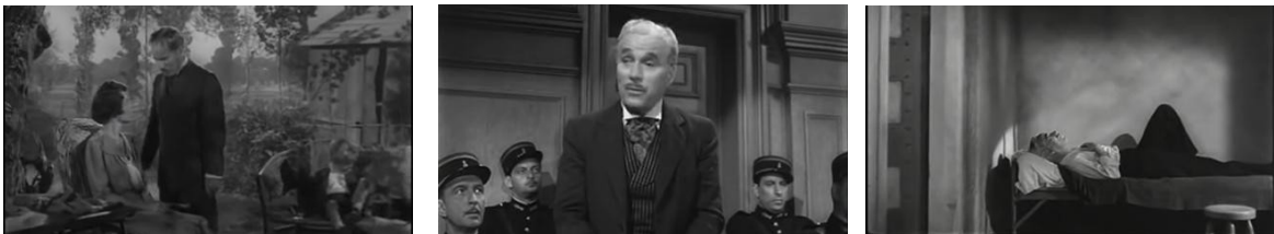
Monsieur Verdoux (1947), Charles Chaplin.

paralítica y su hijo es pequeño e inocente; logrando todo esto que los personajes secundarios afiliados al personaje principal se muestren vulnerables y dependientes de él, lo cual impone aún más presión y responsabilidad a uno de los conflictos del hombre, que es el continuar brindando protección y bienestar a sus seres queridos, a costa de lo que sea.