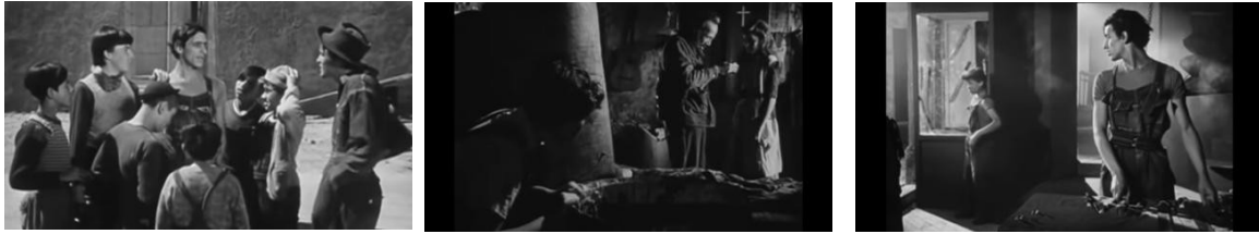
Los olvidados (1950), Luis Buñuel.

Imagen N° 4.- Fotograma de Pedro con la pandilla.