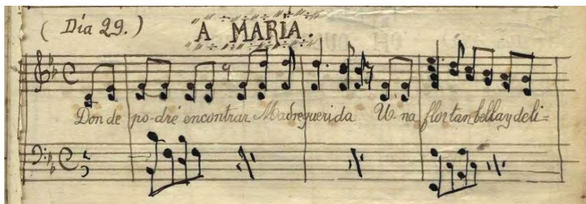
FIGURA 5 INICIO DE LA CANCIÓN DONDE SE VISUALIZA LA PRESENTACIÓN DE LA VOZ CANTADA, EL TECLADO DOBLA LA PRIMERA VOZ E INCORPORA UNA SEGUNDA VOZ.

El orgánico de la obra, como ya se ha expresado anteriormente, aparece escrito para voz y teclado. La voz se encuentra en forma de dúo junto con el piano, y como elemento característico de la época, el de acompañar con el teclado a la voz cantada utilizando intervalos de tercera en la mayoría del discurso, así como, intervalos de sexta, quinta y unísono. Se presenta inicialmente en la tonalidad de Sib Mayor, para en su segunda parte, realizar una inflexión armónica hacia su modo relativo menor, Sol menor, utilizando la dominante como parte de la inflexión armónica, y finalmente regresa a la tonalidad original.