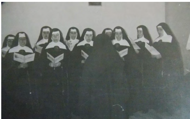
FIGURA 2 FOTOGRAFÍA DE LAS MADRES OBLATAS, PRACTICANDO EL CANTO TOMADA DEL ARCHIVO FOTOGRÁFICO DEL COMPLEJO PATRIMONIAL DE TODOSANTOS, 2014.

La Congregación Oblata constituyó un importante punto de referencia para la difusión, recolección y enseñanza de la música religiosa dentro de la ciudad de Cuenca; en ella se desarrolló, fundamentalmente, la música vocal y tuvo su reconocimiento a lo largo de la historia por sus afamados coros y madres cantoras. El testimonio de esta actividad se ha ido develando a través del trabajo con los diferentes archivos musicales, y específicamente, con el repertorio recuperado que hace alusión a la veneración de la Santísima Virgen María, objeto de estudio de la presente investigación.