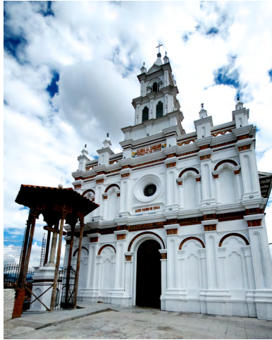
FIGURA 1. FOTO DE LA FACHADA DE LA IGLESIA DE TODOSANTOS DE LAS MADRES OBLATAS, PARTE DELANTERA DE LA CASA CONVENTUAL.

La Congregación Oblata constituyó un importante punto de referencia para la difusión, recolección y enseñanza de la música religiosa dentro de la ciudad de Cuenca; en ella se desarrolló, fundamentalmente, la música vocal y tuvo su reconocimiento a lo largo de la historia por sus afamados coros y madres cantoras. El testimonio de esta actividad se ha ido develando a través del trabajo con los diferentes archivos musicales, y específicamente, con el repertorio recuperado que hace alusión a la veneración de la Santísima Virgen María, objeto de estudio de la presente investigación.