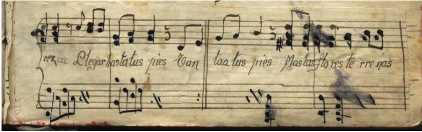
FIGURA 6 ACOMPAÑAMIENTO CON ACORDES DISUELTOS A MODO DE ARPEGIOS Y ACORDES

El acompañamiento no presenta dificultades técnicas y emplea arpeggios y acordes. Desde el aspecto estilístico, la obra se identifica con un estilo de factura sencilla y frases musicales trabajadas por grados conjuntos. La forma musical de la canción tiene dos partes con repeticiones y un solo texto 16 que resalta la adoración a la Santísima Virgen María.