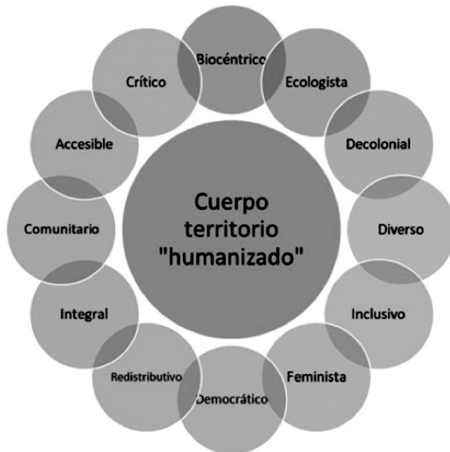
GRÁFICO 2 Segmentaciones interseccionales del cuerpo-territorio

Biocentrismo en lugar de antropocentrismo, ecologismo por consumismo, decolonialidad por dominación y colonialidad, diversidad por uniformidad, inclusión social por exclusión y discriminación, feminismos por patriarcados, democracia por autoritarismo, redistribución por acumulación, integralidad por fragmentación, comunidad por individualismo, accesibilidad a los comunes por privatización, criticidad por normalidad, y así reflexionar sobre las instancias que permiten que el capitalismo continúe con la separación, ruptura, resignificación y desterritorialización de cuerpos y territorios en favor de espacios abstractos como el mercado y la globalización cuya intención es únicamente la acumulación de riquezas.