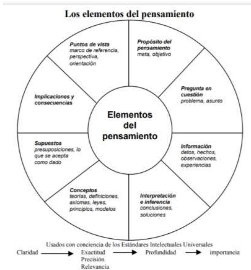
Figura 2. Los elementos del pensamiento según Paul y Elder (2003)

Ilustración 2. Elementos del pensamiento