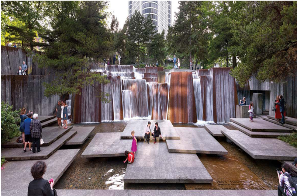
Fig. 3. Auditorium Forecourt Plaza, Oregón, Estados Unidos, 1961, obra de Lawrence Halprin. Pallasmaa llama la atención sobre cómo esta fuente artificial se ha integrado en la atmósfera natural discretamente.

Debemos volver a confrontar la arquitectura con nuestro cuerpo, que es quien la atraviesa. Además, los edificios no sólo albergan nuestros cuerpos, sino también nuestras mentes, recuerdos, deseos y sueños. Por eso está tan arraigada la sensación de que la arquitectura es una extensión de nosotros mismos.