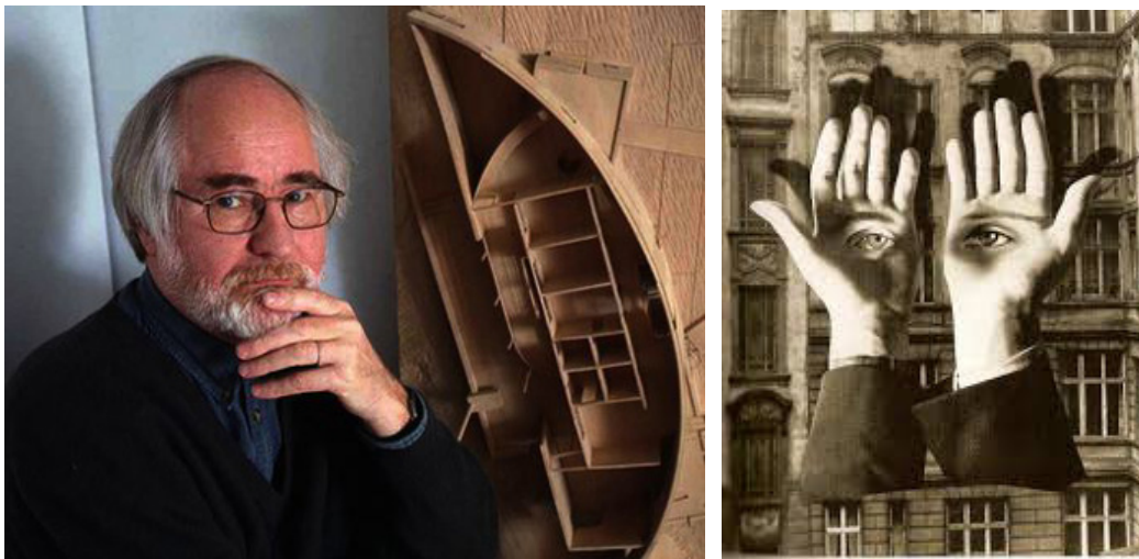
Figs. 1 y 2. Pallasmaa, fotografía actual, y El metropolitano solitario , de Herbert Bayer, 1932. La obsesión contemporánea por el sentido de la vista impide una experiencia vivencial completa.

Hay una suerte de tendencia a la deshumanización en la arquitectura y de eso se ha dado cuenta la crítica actual, dentro de la cual Pallasmaa es uno de los principales defensores de una ciudad más humana. En efecto, su mensaje es que hay que apostar por dar más emotividad a la arquitectura, y explorar la capacidad de los edificios para acoger y enriquecer la vida.