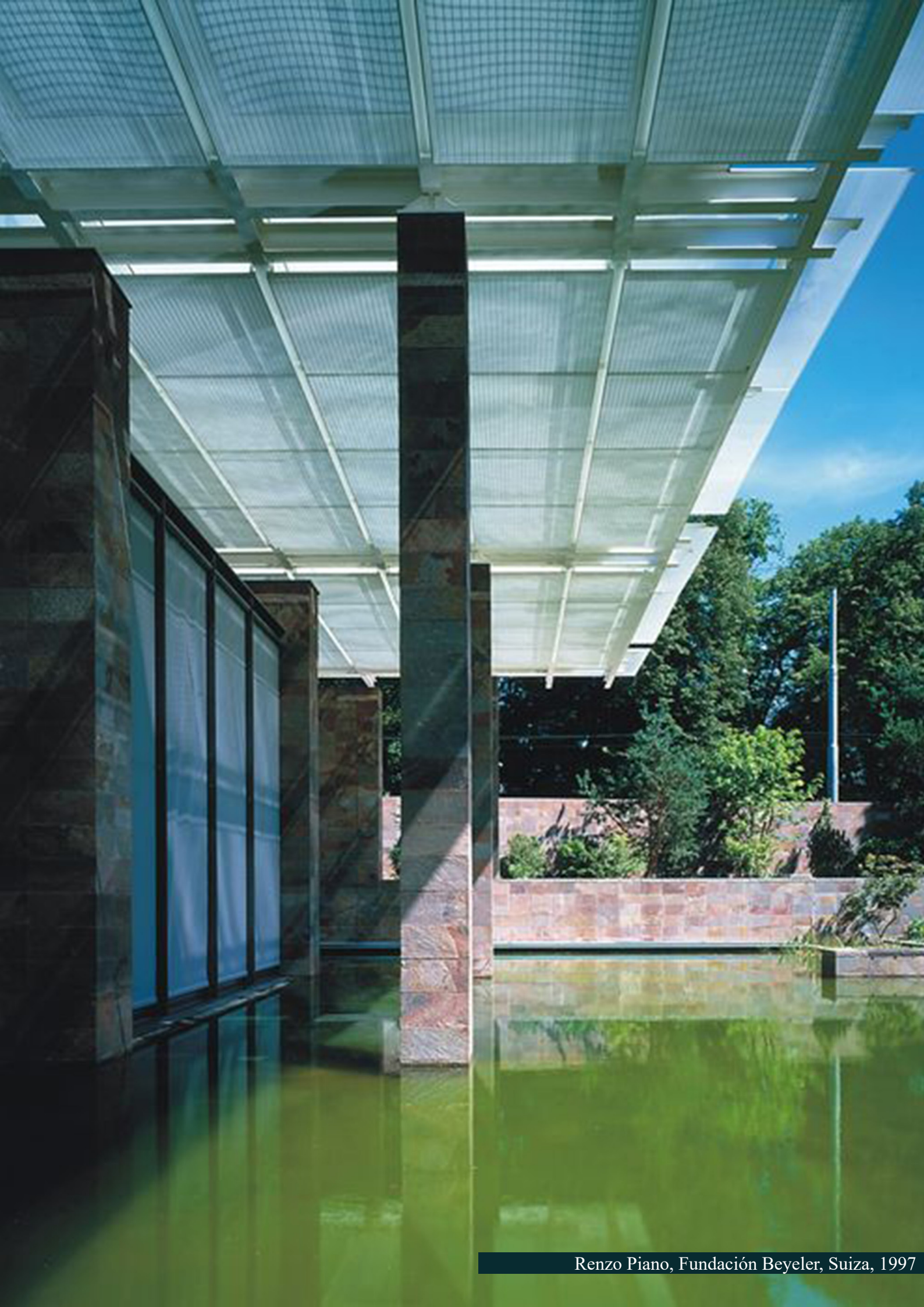
Renzo Piano, Fundación Beyeler, Suiza, 1997