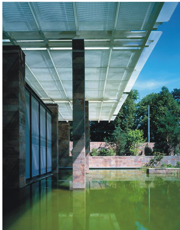
Fig. 5. La arquitectura puede ser sensualmente tectónica y poética. Renzo Piano, Fundación Beyeler, Suiza, 1997. Este museo ofrece, para Pallasmaa, una ideal condición para la contemplación del arte.

La arquitectura no puede surgir de algoritmos, sino de la empatía y de la imaginación humana 28 . Se debe evitar la enseñanza y la práctica de la arquitectura como si fuera la resolución de problemas matemáticos para dar lugar a soluciones eficientes (Fig. 5). Igualmente se debe evitar valorar la arquitectura desde su lado exclusivamente estético o idealizado 29 .