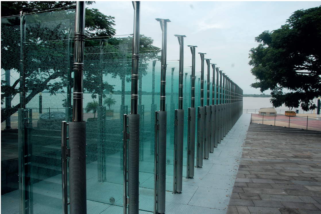
Fotografía: Vicente Gaibor, 2012.