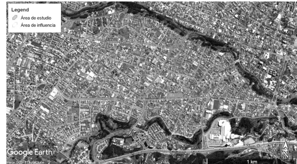
FIGURA 4. PARQUE IBERIA, ÁREA DE INFLUENCIA.