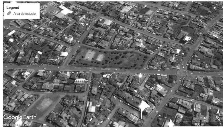
FIGURA 1. PARQUE IBERIA, ÁREA DE ESTUDIO.