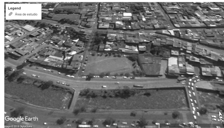
FIGURA 2. PLAZA EL OTORONGO, ÁREA DE ESTUDIO.