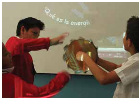
Fotografía 2: Taller "Usos de la Energía". Escuela Albino del Curto. Cantón Limón Indanza.

Este eje busca fortalecer y diversificar las capacidades y potencialidades individuales y sociales, y promover una ciudadanía participativa y crítica. En coordinación con el Ministerio de Educación, CELEC EP-HIDROPAUTE realiza actividades encaminadas a la capacitación y constante información de los habitantes de su área de influencia en biodiversidad, gestión de desechos, cuidado de recursos naturales entre otros. La interacción con la población a través de la educomunicación permite complementar y afianzar los proyectos de desarrollo socio ambiental y orientar sobre el manejo de los proyectos hidroeléctricos. Entre las principales actividades desarrolladas se encuentran: educación ambiental, mejoramiento del nivel de ciencias en educación, capacitación técnica comunitaria, e implementación de centros de información.