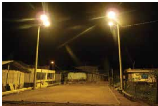
Fotografía 5: Iluminación de cancha deportiva de Santiago de Panantza. Cantón San Juan Bosco.