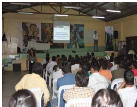
Fotografía 4: Taller de socialización del Proyecto Hidroeléctrico Río Zamora-Santiago. Cantón San Juan Bosco.

Esta información es relevante para responder a la pregunta de por qué una empresa generadora debía involucrarse en la electrificación de las comunidades del área de influencia de sus proyectos: al igual que con otros proyectos de servicios básicos (agua potable, alcantarillado, etc.) el acceso al servicio de electrificación rural es un derecho reclamado durante años por los habitantes de la zona quienes ven a los desarrolladores de proyectos eléctricos como los llamados a satisfacer esa demanda, sin importar si tienen la competencia legal para hacerlo. El no involucrarse en este aspecto puede poner en riesgo las relaciones con la comunidad y, por ende, el éxito mismo del proyecto de generación.