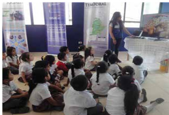
Fotografía 3: Visita de estudiantes al Centros de Información Cantón Limón Indanza. PHRZS.