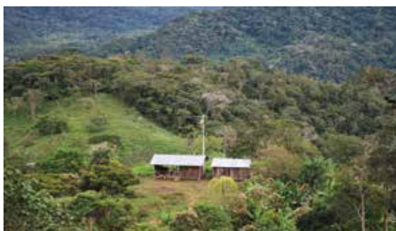
Fotografía 6: Usuario de proyecto de electrificación. Parroquia Bomboa. Cantón San Juan Bosco.

La Tabla 1 muestra las comunidades atendidas con los proyectos de electrificación en la provincia de Morona Santiago: