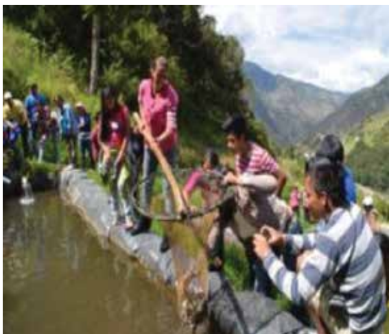
Fotografía 1: Visita al proyecto comunitario de truchas Arcoiris. Proyecto Hidroeléctrico Mazar.

Para el cumplimiento de lo planteado, HIDROPAUTE ha implementado programas con las comunidades y organizaciones, del área de influencia de sus proyectos hidroeléctricos. La fotografía 1 muestra una visita desarrollada por líderes comunitarios de las comunidades del Proyecto Hidroeléctrico Río Zamora-Santiago para conocer los proyectos productivos desarrollados alrededor del Proyecto Paute-Mazar