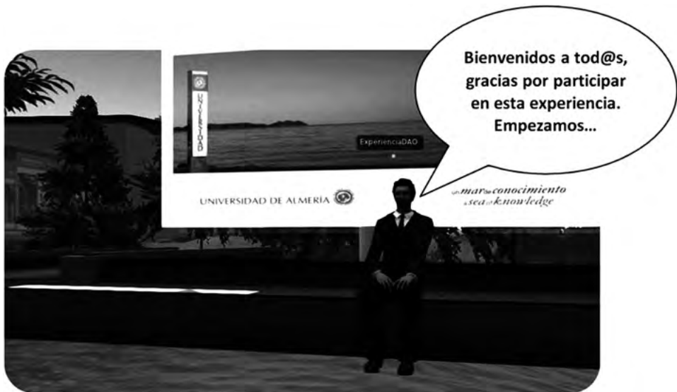
Figura 1. Avatar tutorial «Experiencia DAO» en la Isla UAL-SEIS

Por último, se desarrolló un cuestionario (véase en: https://goo.gl/FYKXEN ) para la evaluación cuantitativa de la satisfacción del alumnado con la Experiencia DAO compuesto por varios ítems y dividido en tres secciones principales (tabla 1): Metodología (M), Interfaz (I) y Adaptabilidad (A). También se incluyó una sección destinada a investigar algunas propuestas que permitiesen mejorar la interfaz y la propia experiencia de enseñanza-aprendizaje (sección de Propuestas (P)). Para la elaboración del cuestionario se tuvieron en cuenta, por una parte, los atributos principales a introducir para conocer las fortalezas y debilidades del recurso docente basado en entornos inmersivos 3D. Por otra, las características propias de evaluación que se requieren para la aplicación posterior del modelo de estimación de la satisfacción de las personas usuarias propuesto por Kano.