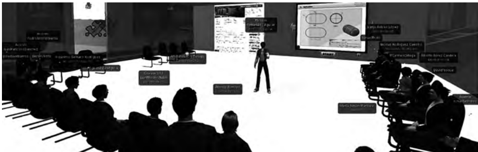
Figura 2. Panorámica del aula de CAD en la Isla UAL-SEIS durante una de las sesiones programadas

Una vez completadas todas las sesiones planificadas, y en una sesión presencial, tras explicar detenidamente el procedimiento para contestar el cuestionario comentado en el apartado anterior, se procedió a la cumplimentación del mismo por parte del grupo de estudiantes participante. La versión final del cuestionario constó de 20 preguntas dobles, una directa y otra complementaria. Tanto las preguntas directas (funcional o positiva) como las complementarias (disfuncional o negativa) tenían cinco opciones de respuesta: «me gusta», «lo esperaba», «me da igual», «puedo tolerarlo», «no me gusta». También se añadieron dos preguntas adicionales en relación a posibles líneas de trabajo futuro. Asimismo, y en la parte final de dicho cuestionario, se añadieron dos cuestiones abiertas para su evaluación cualitativa.