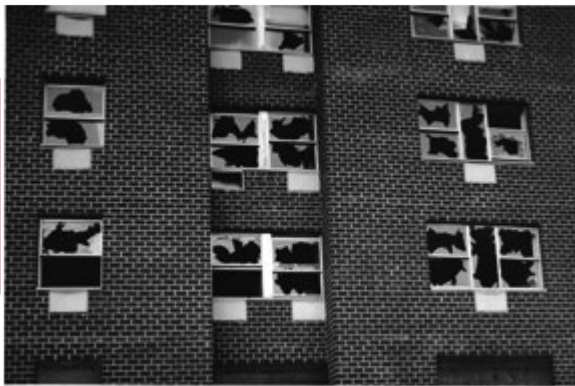
Figura 2. Matta-Clark. Window Blowout, 1976

De igual modo, el profesor advierte que las imágenes arquitectónicas generadas por computadora (habituales en el ámbito profesional y de la enseñanza) parecen ser ejercicios gráficos que no aspiran a reflejar un sentido esencial de realismo. Son el reflejo del éxtasis y del ilusionismo contemporáneo, pero no muestran las problemáticas y valores verdaderos de la vida. Pallasmaa admite que no aboga por el conservadurismo nostálgico, pero sí es partidario de una arquitectura que reconozca su germen histórico y cultural, social y mental. De acuerdo a sus propias palabras: “Si una obra de arquitectura aspira a tener un impacto mental permanente, debe implicar nuestra imaginación personal y activa” (p. 123).