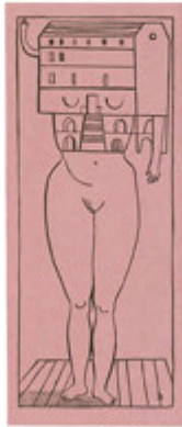
Figura 1. Portada del libro, con una ilustración de Louise Bourgeois

La imagen corpórea es un libro del afamado arquitecto y profesor finés Juhani Pallasmaa, que trata acerca de la imagen, pero sobre todo de la imaginación, atributo esencial de la condición humana, y fundamental para la arquitectura.