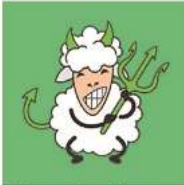
El encantador de borregos