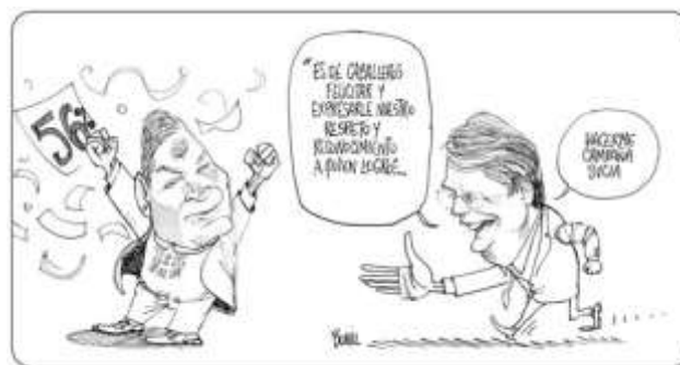
La Felicittata del Caballero del Barrio