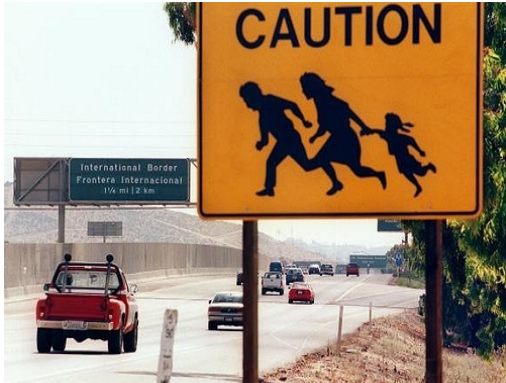
Cruzar la frontera México – EU como atracción turística 15 sep. 2006