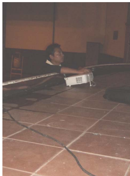
Ajustando la imagen del proyector en la pared