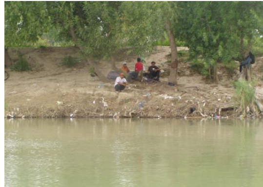
Migrantes en Tamaulipas, 27 Ago. 2010

Los inmigrantes son y han sido el sostén económico de Estados Unidos. A principio de la época republicana y para hacer a este país una potencia económica se usó la mano de obra de los esclavos y por más de 500 años la mano de obra fue gratis. Este apogeo económico y cuantiosas ganancias sin hacer ningún pago permitieron que los Estados Unidos se enriquecieran y que la gran mayoría de la riqueza que los europeos robaron del continente Americano y del continente Africano pase a las manos de los capitalistas en nuestro país. Con la abolición de la esclavitud, la fuente de mano de obra gratis fue y son ahora los inmigrantes.