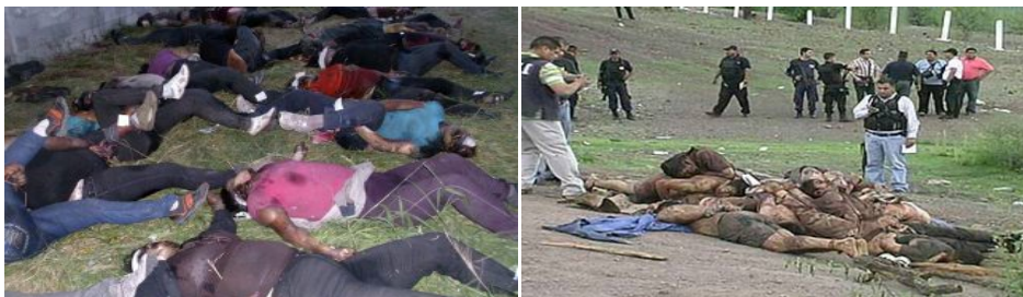
72 migrantes muertos en Tamaulipas, 26 de agosto de 2010